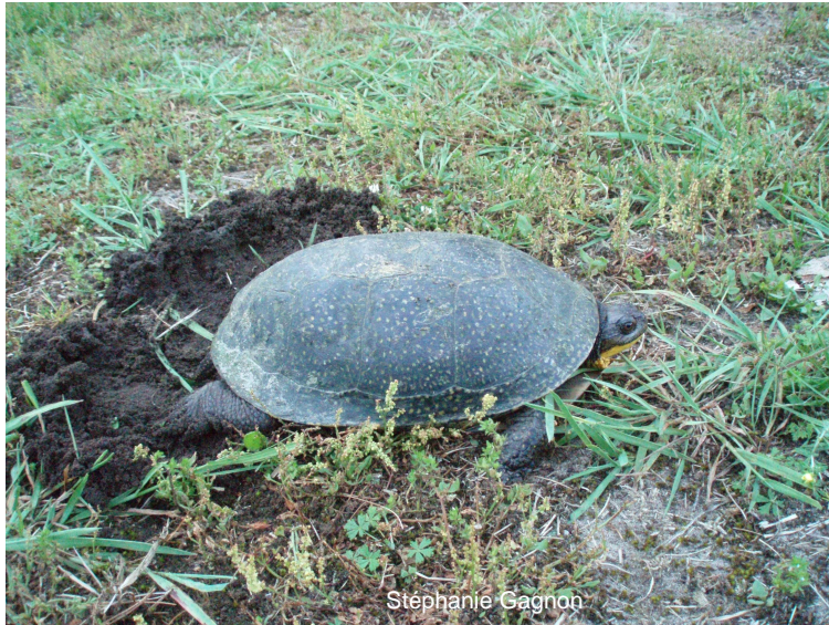
Tortue mouchetée en train de pondre.

Trois raisons appuient cette solution : (1) ce site a été sélectionné par la femelle pour ses caractéristiques (ensoleillement, type de substrat, humidité, etc.); (2) il faut minimiser la manipulation et le transport des œufs compte tenu de leur fragilité et; (3) la tortue qui a pondu à cet endroit provient d'un plan d'eau situé dans ce secteur, il est donc important que les jeunes tortues issues de ces œufs retournent dans ce même secteur. C'est pour ces raisons que la relocalisation de nids de tortues doit être considérée comme une technique de dernier recours. Pour recréer un nid et manipuler les œufs, consulter la section suivante.