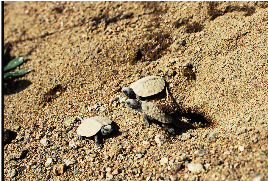
Jeunes tortues des bois venant d'éclore

Les œufs devraient éclore autour du mois de septembre et les jeunes tortues rejoindront d'elles-mêmes le plan d'eau à proximité. S'il s'agit d'œufs de tortues peintes ou de tortues géographiques, il est possible que les jeunes tortues passent l'hiver dans le nid pour émerger au printemps suivant. Si par hasard, vous assistez à l'émergence des jeunes tortues, prenez quelques photos et identifiez l'espèce à l'aide de guides spécialisés (ex : Desroches et Rodrigue, 2004). Nous vous encourageons encore à faire parvenir ces informations à l'Atlas des amphibiens et reptiles du Québec.