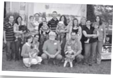
Naissances de l'hiver 10 filles • 8 garçons