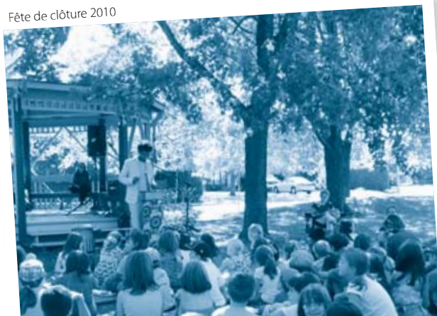
Fête de clôture 2010

☎ poste 8500 ✉ bibliotheque@ville.saint-basile-le-grand.qc.ca