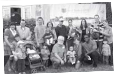
Naissances de l'automne 4 filles • 3 garçons