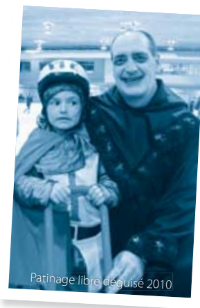
Patinage libre déguisé 2010

✉ viecommunautaire@ville.saint-basile-le-grand.qc.ca