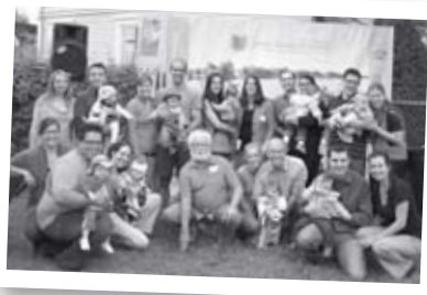
Naissances de l'été 12 filles • 3 garçons