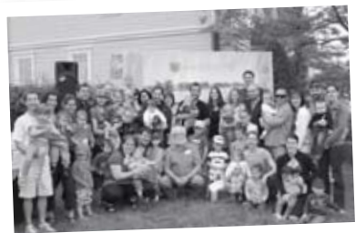
Naissances du printemps 11 filles • 9 garçons