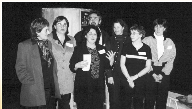
Les partenaires du Comité de sécurité alimentaire

La vie communautaire a toujours été fort active à LaSalle. Au cours des années 90, plusieurs problématiques ont motivé la création de comités et de tables de concertation sectorielles solides.