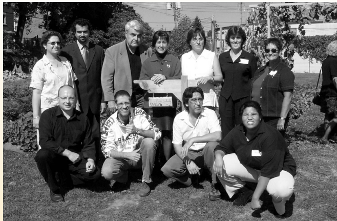
Inauguration officielle de Éco-Jardins LaSalle : les membres du conseil d'administration et les conseillers de l'arrondissement.

Le Carrefour des organismes communautaires de LaSalle, une représentante de l'arrondissement ainsi qu'une représentante du CLSC LaSalle ont mis en place un comité de travail sur le développement social qui doit élaborer un plan d'action. Désireux d'avancer la réalisation de son mandat, le comité travaille activement à élargir le nombre de ses membres et de ses partenaires.