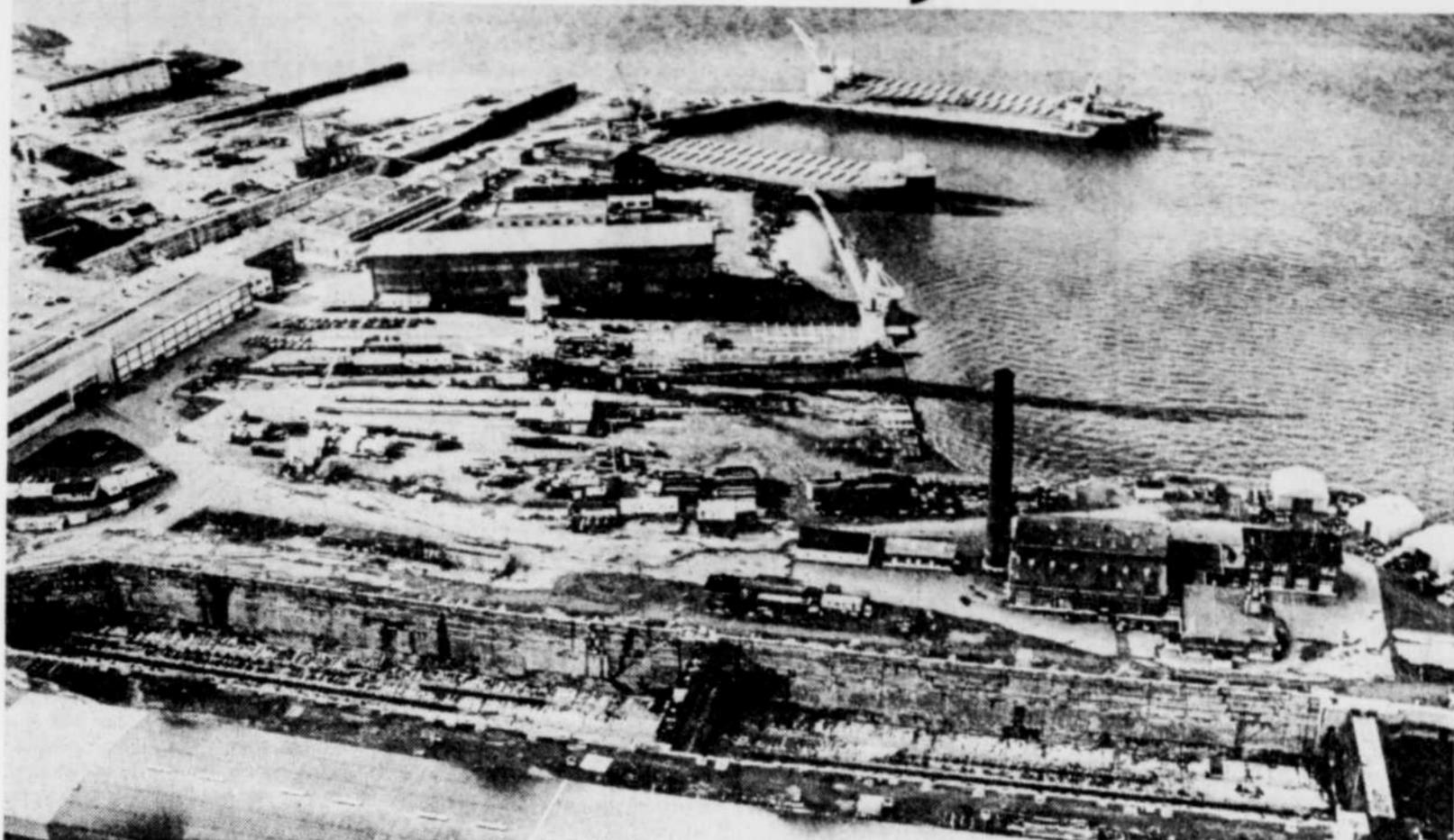
Le Soleil, Clément Thibault

« On veut savoir par exemple, de confier le ministre Côté au SOLEIL, combien peut coûter la construction des six frégates au chantier de Saint-Jean. Quel serait le prix de la construction de cinq frégates au Nouveau-Brunswick et une au Québec. Si on en construit deux au Québec et quatre au Nouveau-Brunswick, combien cela coûterait-il? Quel serait également le coût de construction de trois frégates au chantier de la St. John et trois au Québec. C'est cela que l'on veut savoir. »