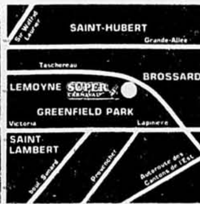
Greenfield Park 1011, boul. Taschereau