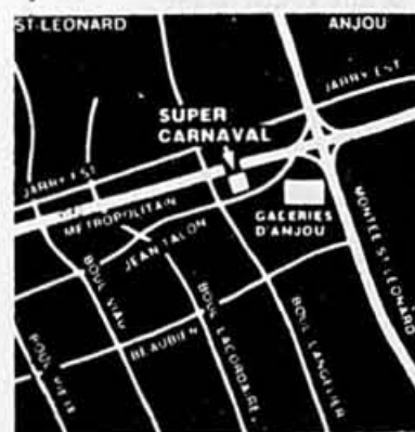
St-Léonard 6875 Jean-Talon est