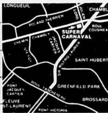
Longueuil 3630 ch. Chambly