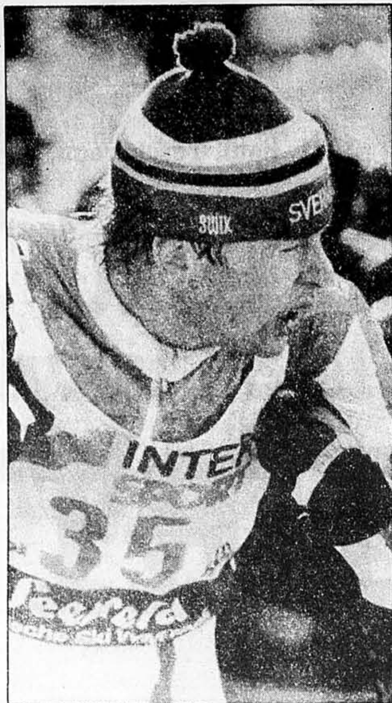
Le Suédois Gunde Swan, détenteur de la Coupe du Monde, a remporté la première épreuve du 30 km disputé hier à Seefeld, Autriche.