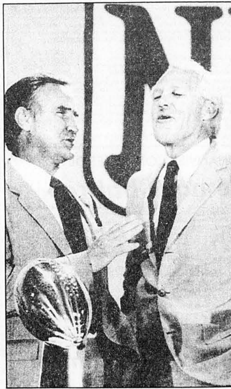
Don Shula et Bill Walsh n'ont pas osé prédire le vainqueur du Super Bowl de demain. Mais tous deux sont d'accord sur un point: ce sera un match très offensif.