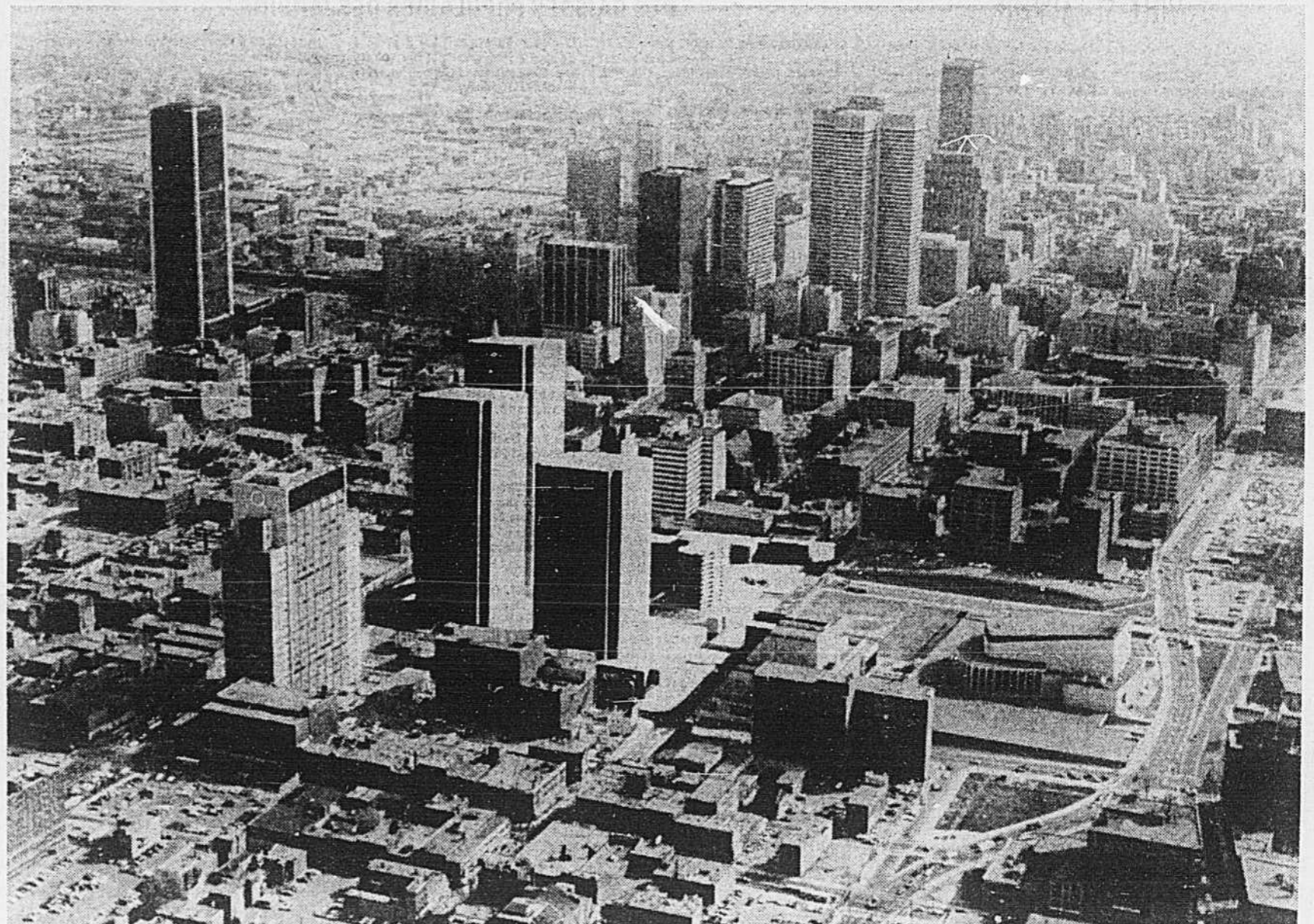
L'emplacement de Place Desjardins est situé dans le centre-ville de Montréal

Une fois terminé, le complexe sera occupé par le gouvernement du Québec, l'Hydro-Québec, les Institutions du Mouvement des caisses populaires Desjardins, l'Union régionale de Montréal des caisses populaires Desjardins, la Sauvegarde et la Sécurité, compagnies d'assurance vie, et la Société de fiducie du Québec.