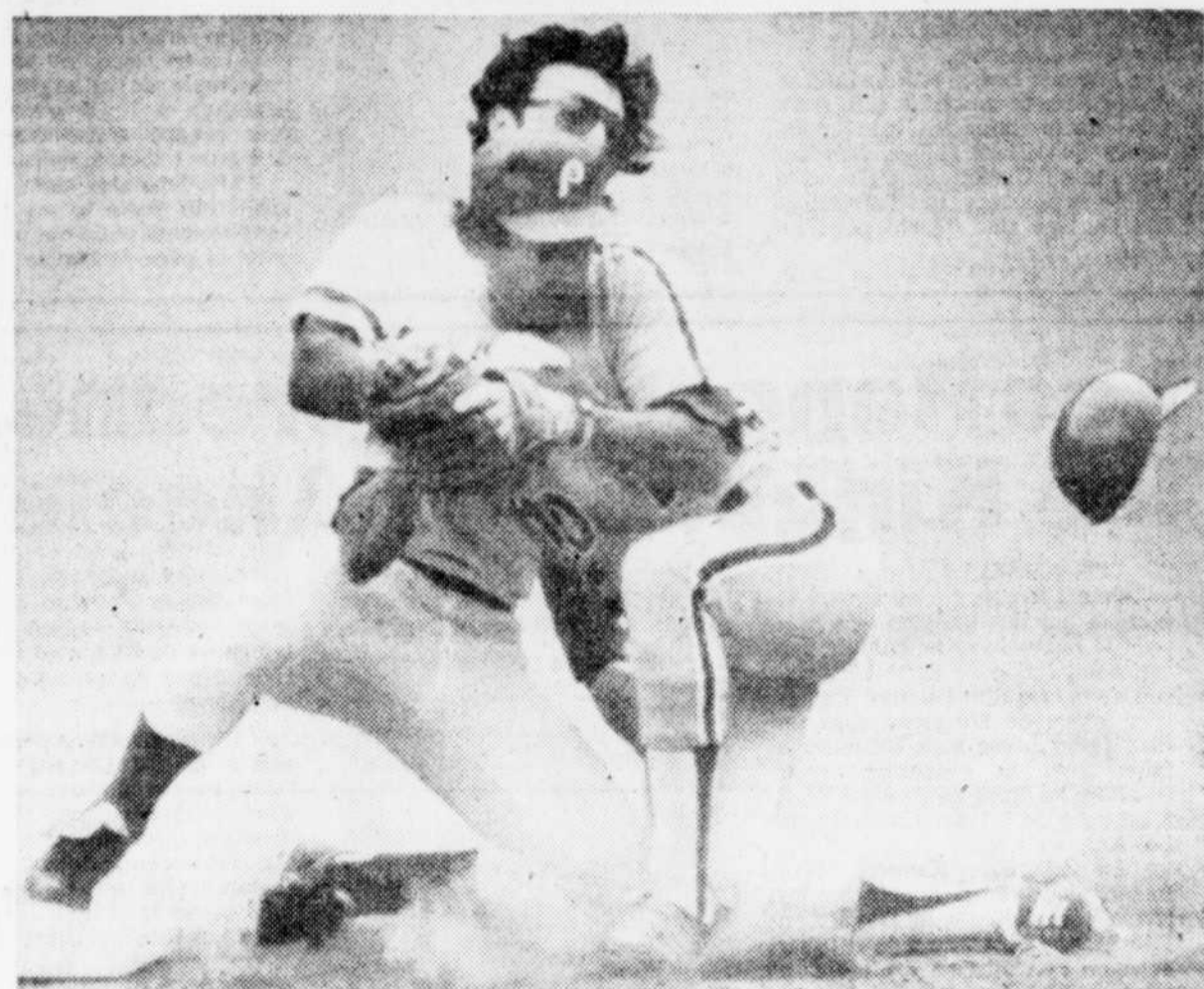
La saison de baseball est commencée, et les collisions au deuxième cousin aussi. Dave Collins, des Reds, a perdu sa casquette en entrant en collision avec Larry Bowa, des Phillies. Verdict de l'arbitre: Collins est retiré.

••• Le match de samedi a été reporté à 14h50 et sera présenté au réseau français de Radio-Canada.