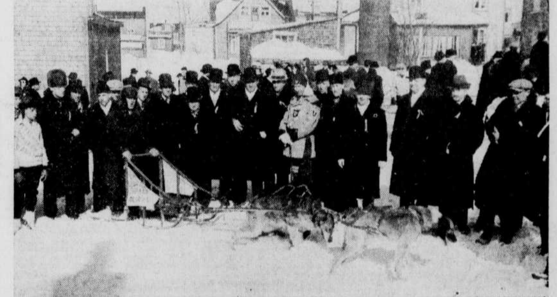
Une captivante course de chiens entre "mushers" de la rive sud est l'une des attractions qui fut présentée, en fin de semaine, à l'occasion du festival sportif annuel de Lauzon. Au premier plan, l'attelage de La Jeunesse L. libérale de Lévis, conduite par M. A. Roberge.