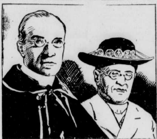
LE CARDINAL FACELLI ET PIE XI étaient des amis intimes et on dit que le pontife défunt avait regardé souvent son secrétaire d'état comme son successeur éventuel. Le 2 février, quand mourut Pie XI, le cardinal Pacelli prit temporairement la direction des affaires de l'Eglise.