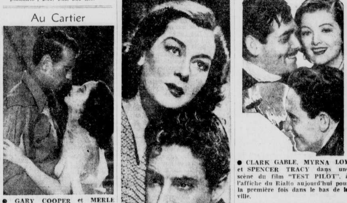
GARY COOPER et MERLE OBERON dans "THE COWBOY AND THE LADY", à l'affiche du Cartier, aujourd'hui et demain.

CAMBRAI - "Romance in Paris" "Lloyd of London". Représentations à 1.30 et 7.15 hrs. Vaudeville sur la scène. Sensation of 1939, à 3.15 et 8.15 hrs. CANADIEN - "Bichon". 12.45, 6.45 hrs. "La Citadelle du Silence". 2.20, 8.20 hrs. "Ça, c'est du Sport". 4.15, 10.15 hrs. CAPITOL - Représentations à 2 h., 7 h. et 8 heures. "Everybody's Baby" à 2 h. 15, 7 h. et 10 h. 15. "The Citadel" (112 minutes) à 3 h. 25 et 8 h. 15. CARTIER - "The Cowboy and the Lady" et "Hard to Get". Représentations à 2 hrs et 7 hrs. CINEMA DE PARIS - "Les Nouveaux Riches". 2.24, 8.24. "Ma Soeur de lait". 12.30, 3.54, 8.30, 9.54. "Sa Sainte Pie XII". 3.44, 9.44. EMPIRE - "Going Places". 3.21, 6.45, 9.30. "Comet over Broadway". 1.58, 8.27. FRANCAIS - "Breaking the Ice". 1.30 et 8.35. "Radio Patrol". 3.00 et 8.15. "Daughter of Shanghai". 3.20, 7.00 et 9.20 hrs. IMPERIAL - "The Game that Kills". 1.00, 3.38, 7.00, 9.38 hrs. "Drums". 2.21, 8.21 hrs. PRINCES - "With Pleasure, Madame". 1.00, 3.50, 7.00, 9.50 hrs. "The Young in Heart". 2.20, 8.20 hrs. RIALTO - "The Tiger of Bengal". 2.25, 6.45, 10.10 hrs. "Test Pilot". 3.30, 8.20 hrs. VICTORIA - "Les Roux du Sport". 1.00, 3.50, 6.40, 9.30 hrs. "Tamara la Complaisante". 2.50, 5.35, 8.30 hrs.