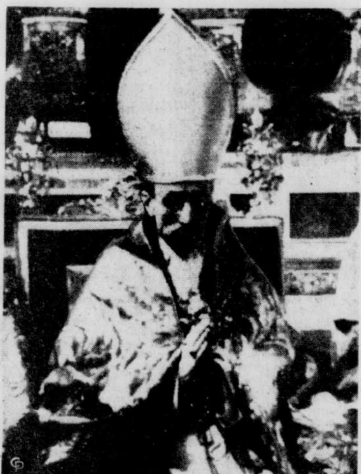
Voici la première photographie du Pape Pie XII dans la chapelle Sixtine alors qu'il recevait pour la première fois les hommages des cardinaux de la Sainte Eglise romaine. Le Pape portait les ornements de sa dignité et la mitre précieuse.

Pour la première fois depuis 1846 la foule romaine a pu assister hier, de la place St-Pierre, au couronnement d'un pape — La cérémonie qui se passa à l'intérieur de l'église dépasse en beauté et en magnificence tout ce qu'on a vu jusqu'ici — Une ovation formidable au nouveau Pontife — La première bénédiction.