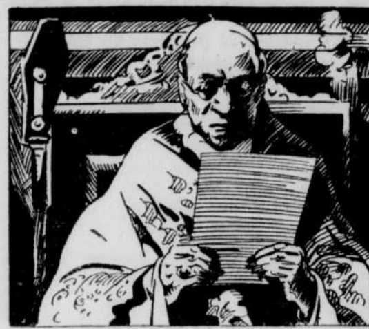
APRES AVOIR pendant plusieurs années travaillé pour la paix, il conçoit que le nouveau pontife lance son premier appel public en faveur de la paix. Ses paroles, portées au monde entier par la radio, arrivèrent au moment où le monde avait besoin de ces sages conseils car la situation est critique en Europe.