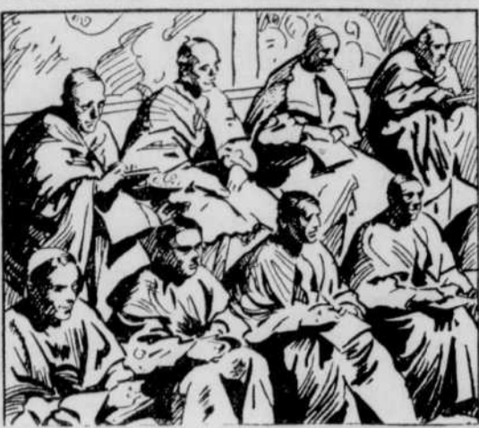
LE COLLEGE des cardinaux entra en conclave le 3 mars pour choisir un nouveau pape. Au troisième tour de scrutin, le 2 mars, jour du dixième anniversaire de sa naissance, le cardinal Pacelli était choisi unanimement pour monter sur le trône de St-Pierre et prenait le nom de Pie XII, en l'honneur de son prédécesseur.