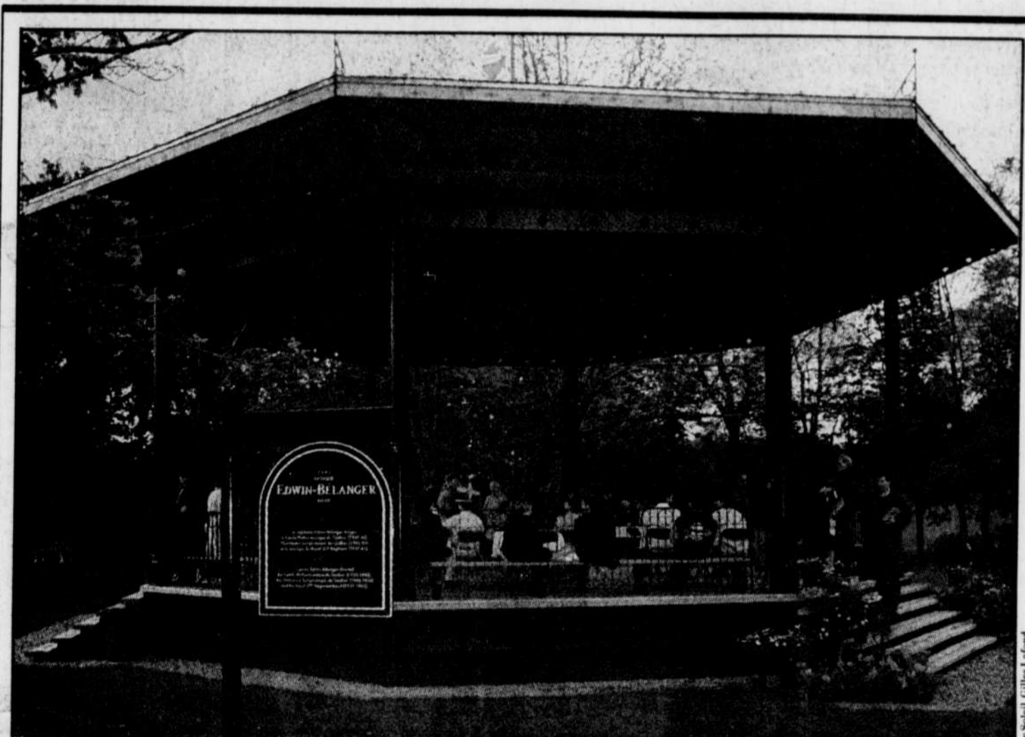
Un kiosque spécial vient d'être inauguré sur les plaines d'Abraham, à Québec, pour les spectacles musicaux. Il portera le nom d'Edwin-Bélanger, ce capitaine qui fonda le Cercle philharmonique de Québec en 1935 et dirigea l'Orchestre symphonique de Québec et La Musique du Royal 22 e Régiment, respectivement de 1942 à 1951 et de 1937 à 1961.

L'article 28, à la section 4 de la Loi sur la transformation des produits marins, prévoit que « la décision de la cour du Québec est sans appel » lorsqu'un promoteur, insatisfait d'une décision ministérielle, porte sa cause devant les tribunaux « sur toute question de droit et de compétence ». Au cabinet du ministre Vallières, Christian Barrette soutient toutefois que, selon les procureurs du ministère, « une requête en mandamus accordé automatiquement un droit d'appel ».