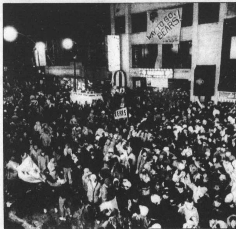
C'était l'euphorie, dimanche soir, dans la Ville des vents. Quelque 10,000 partisans des Bears, trop longtemps frustrés, en ont profité pour lâcher leur fou dans le populaire quartier des bars et des restaurants du North Side.

NOUVELLE-ORLÉANS (AP) — Ses joueurs parlaient de dynastie, mais Mike Ditka a refusé de le faire, déclarant hier que ses Bears de Chicago devraient faire aussi bien durant toute la prochaine saison de la NFL pour être comparés à des équipes comme les Packers de Green Bay et les Steelers de Pittsburgh. « Je ne crois pas au mot dynastie », a dit Ditka lors d'une conférence de presse, au lendemain de l'écrasante victoire de 46-10 des siens sur les Pa-