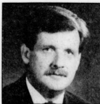
Le maire Pierre PELLETIER

Celui-ci indique cependant qu'il est encore trop tôt pour parler de gel des salaires des employés municipaux pour 1993 et 1994. « Mais ça donne le ton pour les négociations de 1994. Car même si tout le monde est réglé pour 1993, et que même si les conventions sont signées pour 1994, il y'en a dans lesquelles les salaires ne sont pas réglés, comme