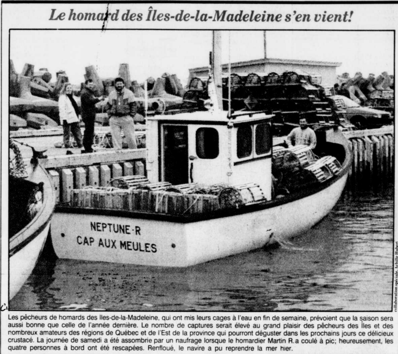
Le homard des Îles-de-la-Madeleine s'en vient!

Dans tous les cas, la société d'État s'est montrée quasi inflexible face aux moyens de pression mis de l'avant par les gens du milieu.