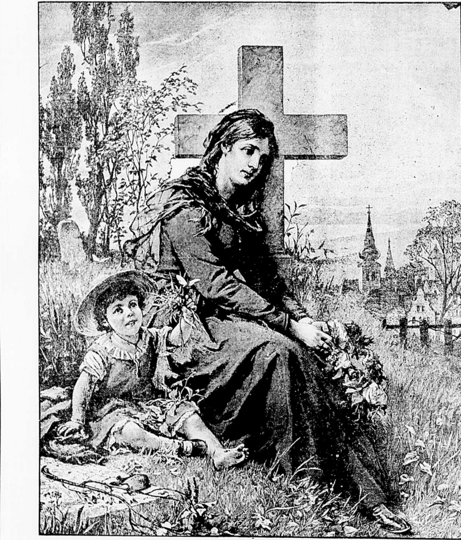
IN MEMORIAM: LES FLEURS POUR LA TOMBE.