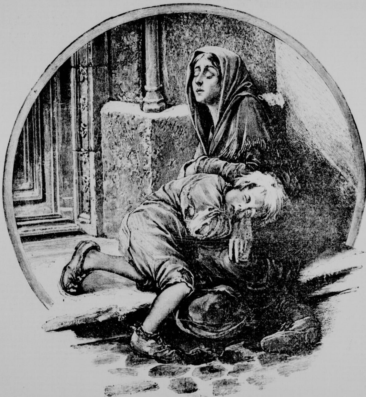
MISÈRE ! — DESSIN DE M. THADÉE

La ligne, par insertion - - - - 10 cents Insertions subséquentes - - - - 5 cents Tarif special pour annonces à long terme