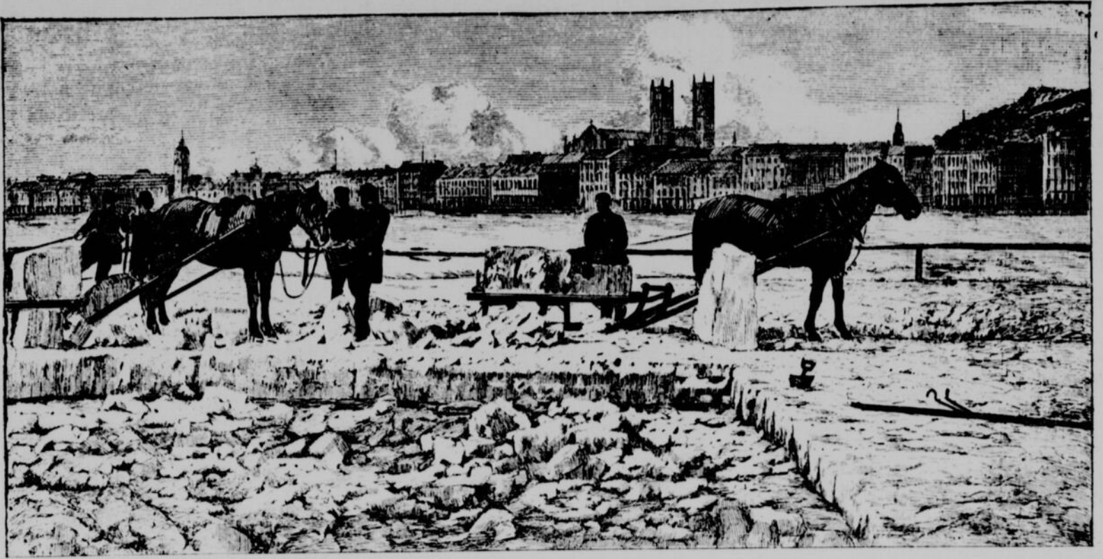
LE CHARROYAGE DE LA GLACE