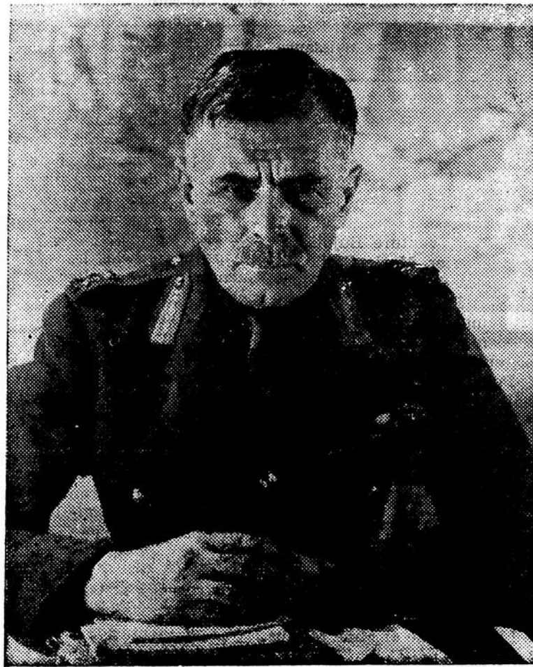
Le lieutenant-général A. C. L. McNaughton, C.B., C.M.G., D.S.O., M.Sc., L.L.D., commandant du Corps canadien outre-mer. C'est le type même du commandant d'armée moderne, puisqu'il est à la fois un savant et un militaire de grande réputation, ce qui fait de lui l'un des soldats les plus scientifiques de sa génération.