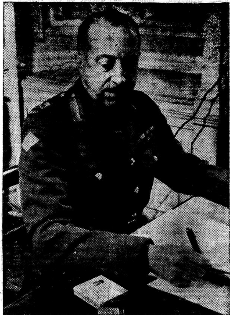
Le lieutenant-général H. D. C. Crerar, D.S.C., qui a volontairement rétrogradé un grade de major-général pour accepter le commandement d'une division canadienne outre-mer, et qui est commandant intérimaire du Corps canadien outre-mer pendant que le lieutenant-général McNaughton est en voyage au Canada. Le général Crerar était précédemment chef de l'Etat-Major général à Ottawa. La photographie ci-dessus a été prise récemment en Angleterre.