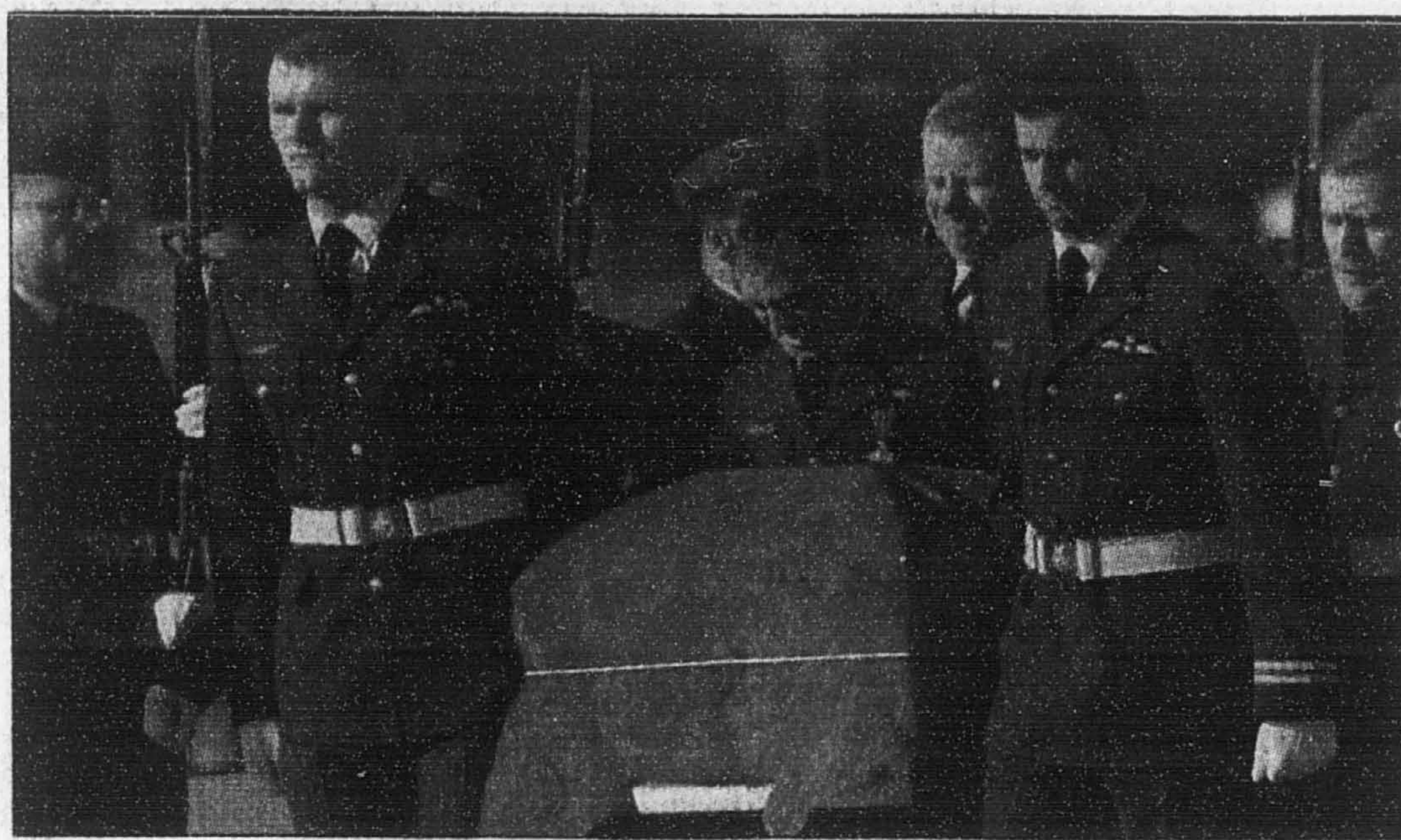
Des militaires canadiens transportent le cercueil de l'une des six victimes de l'écrasement d'un hélicoptère Labrador, survenu la semaine dernière en Gaspésie, à l'occasion des funérailles qui se sont déroulées à la base de Greenwood, en Nouvelle-Écosse.

La mort des deux techniciens en recherche et sauvetage qui faisaient partie du malheureux équipage porte à sept le nombre de décès en