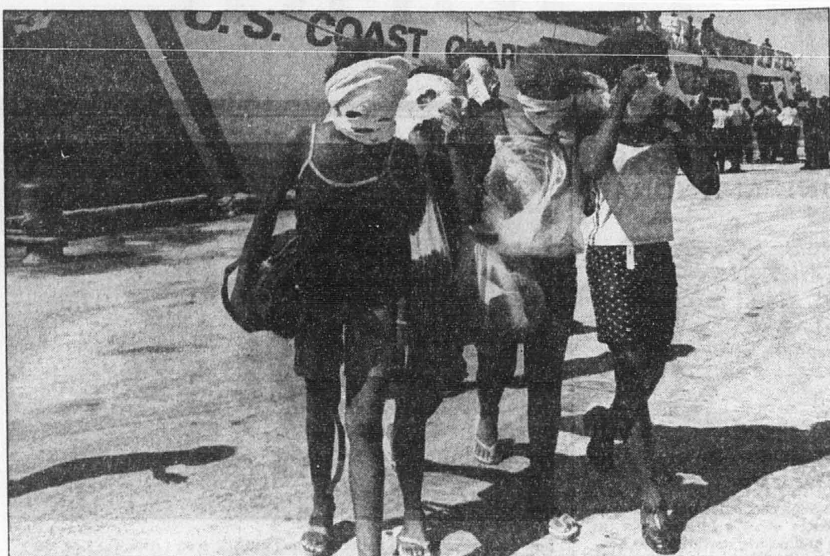
Ces réfugiées refoulées se couvrent le visage dans l'espoir de ne pas être reconnues à leur arrivée à Port-au-Prince.