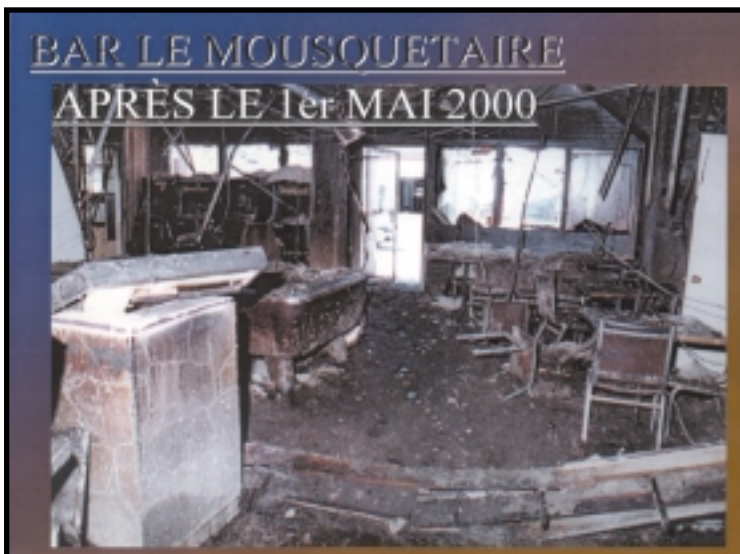
APRÈS LE 1ER MAI 2000

Utilisez la ligne 1 800-659-GANG, c'est AGIR ENSEMBLE contre l'intimidation. Car s'unir c'est le début d'une victoire assurée.