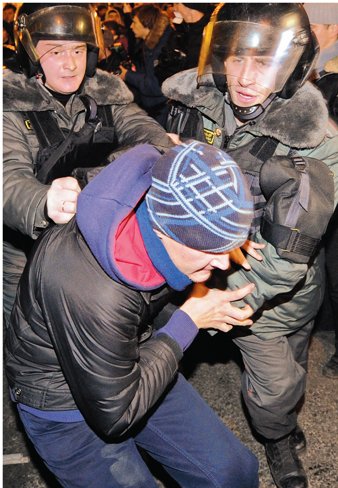
Malgré le mécontentement, aucun politicien russe n'a encore réussi à se faire élire grâce à la mobilisation en ligne.

Devant cette contestation naissante, le gouvernement n'est pas demuni. Dans la rue, il procède à des interpellations multiples puis à des comparutions immédiates. Il fait désormais presque dans la subtilité, ayant annoncé hier (vendredi) que les lycéens de Moscou avaient été convo-