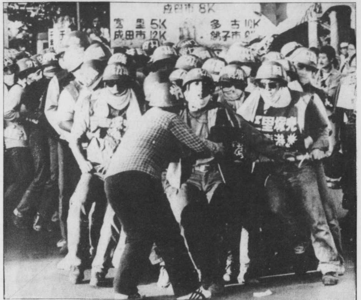
Plus de 10,000 contestataires à l'établissement de l'aéroport international du Nouveau-Tokyo dansent dans les rues de Narita, à 65 km au nord-est de la capitale, pour marquer leur désapprobation. Le même scénario s'est répété des centaines de fois depuis que le gouvernement japonais a choisi ce site en 1966. Le bilan de toutes ces années de conflit s'élève à cinq morts et 3,400 blessés pour la police et à un mort et des milliers de blessés dans les rangs des opposants.

Depuis l'automne, les extrémistes ont notamment incendié le quartier général du Parti démocratique libéral au pouvoir, les bureaux de trois de ses membres et la résidence du gouverneur de la province de Chiba. Ils ont attaqué plusieurs fois à la ro-