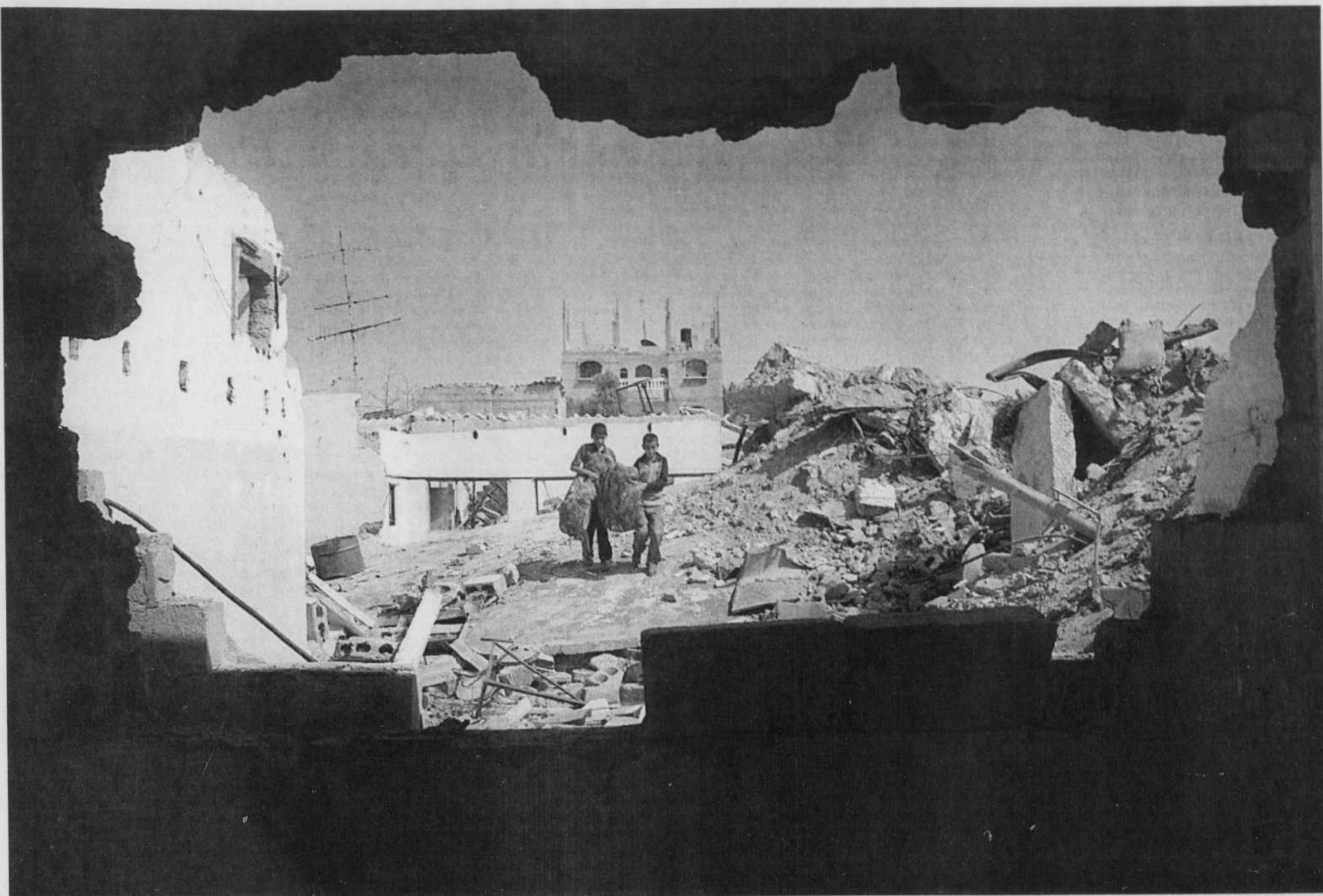
Deux jeunes Palestiniens récupèrent leurs biens après la destruction de leur maison par les tanks et les bulldozers israéliens, dans le camp de réfugiés de Rafah. «Le bulldozer que l'on croise partout au bord des routes, témoigne Christian Salmon, apparaît tout aussi stratégique que le tank dans la guerre en cours. Jamais un engin aussi inoffensif ne m'était apparu porteur d'une telle violence muette. Brutalité des bulldozers. La géographie, dit-on, ça sert d'abord à faire la guerre. En Palestine, c'est la guerre qui défait la géographie.»