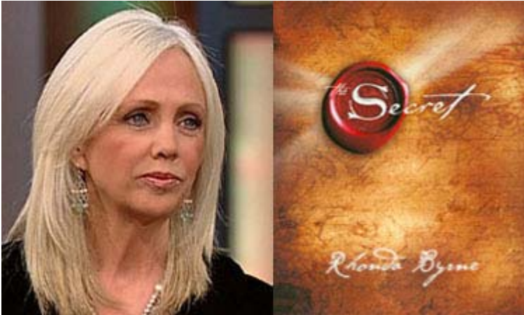
Rhonda Byrne et son livre "The Secret"

L'auteur Rhonda Byrne est un exemple concret du phénomène de best-seller. Son livre: «The Secret» n'est pas unique et il suggère une formule de pensée positive. Le marché pour ce genre d'ouvrage est parfois limité à un auditoire très spécifique mais dans le cas de «The Secret» le succès est mondial. La raison est la participation de l'auteure à deux reprises à l'émission de Oprah Winfrey et une autre à l'émission de Larry King. Les ventes du livre dépassent 4 millions de copies et plusieurs produits dérivés viennent compléter l'offre. L'ouvrage est un recueil d'une vingtaine d'experts pour qui la vie peut-être influencée par la pensée. L'auteure est la preuve du succès de la recette car jusqu'en 2004, sa vie était un échec sur toute la ligne. Aujourd'hui, elle est un succès!