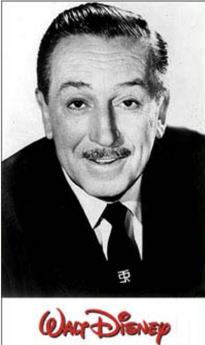
Walt Disney (1901- 1966)