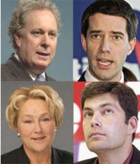
Jean Charest, André Boicclair Pauline Marois et Mario Dumont

Les Québécois iront aux urnes le 26 mars prochain et leur choix est plutôt difficile à faire car aucun des chefs de parti ne fait l'unanimité. Plusieurs électeurs voudraient changer l'actuel Premier ministre Jean Charest mais ils ne peuvent se résigner à choisir le leader indépendantiste André Boicclair dont on critique l'attitude hautaine. Un sentiment de doute entoure le troisième aspirant, Mario Dumont alors que l'on dit craindre son manque d'expérience. Plusieurs militants de l'indépendance du Québec disent qu'ils n'iront tout simplement pas voter et certains mentionnent même regretter ne pas avoir choisi Pauline Marois comme chef du parti. On peut croire que le débat télévisé du 13 mars sera déterminant dans le choix des électeurs qui iront voter. (Voir éditorial) www.LeStudio1.com/Editeur