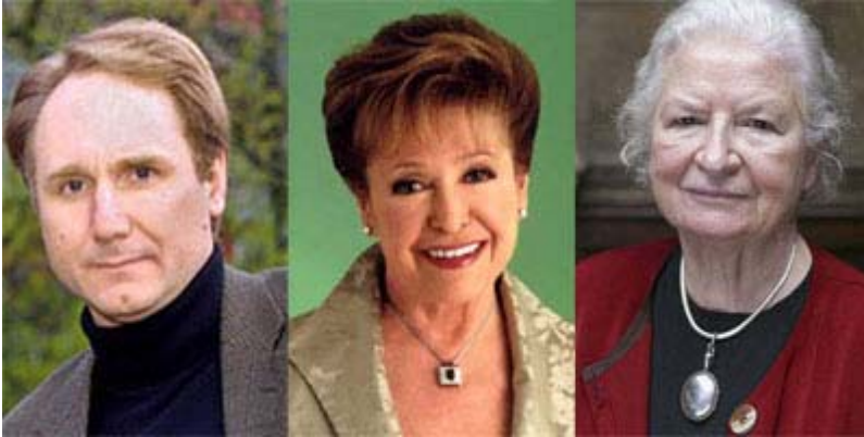
Dan Brown, Mary Higgins Clark et PD James

L'écriture d'un best-seller est le rêve de tous les auteurs. Mais il ne faut croire que tous les succès littéraires sont aussi des bons livres. La publication de livre est avant tout un exercice de marketing! Le film documentaire: « Best-Seller à tout prix » présenté dans le cadre Festival International du film sur l'art le démontre encore une fois. Le film présente le témoignage d'auteurs à succès mais aussi des éditeurs chez Harper Collin et Robert Lafond. Tous sont unanimes: Un livre est un succès s'il se vend et cela n'a rien à voir la qualité de l'écriture. Pour vendre, au delà de 70 000 copies, il faut un phénomène d'entraînement. Être l'invité d'une Oprah Winfrey peut être le début du mouvement de masse. www.ArtFIFA.com