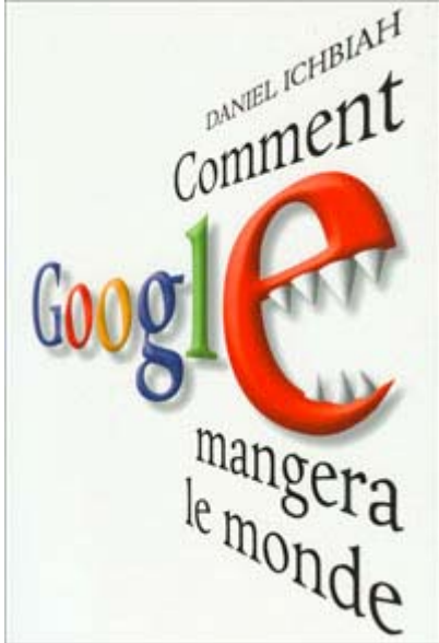
Couverture livre "Google" (L'Archipel)

Le livre : " Comment Google mangera le monde " vient s'ajouter à la liste des quelques bons ouvrages qui font le récit de l'histoire de Google. L'auteur, Daniel Ichbiah , a cependant ajouté à son historique l'explication du rôle de chacune des entreprises qui ont côtoyé Google dans le développement de l'Internet dont les Microsoft, Apple, Yahoo!, AOL, Netscape et tous les autres. Le regard est très objectif et permet de bien saisir la réalité de ce phénomène de société. Mentionnons deux chiffres: Google réalisait des ventes de 220,000$ en 1999 tandis que le total atteignait près de 1 milliard$ en 2003. L'analyse du journaliste français est très captivante! http://ichbiah.online.fr