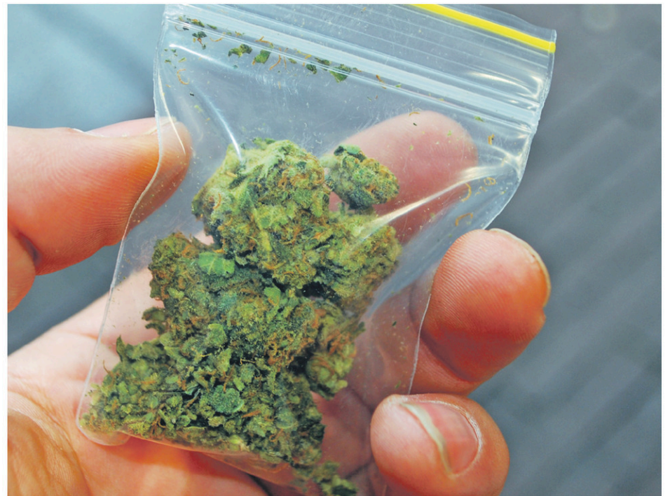
La production de cannabis sera limitée à une portion du parc industriel de Farnham.