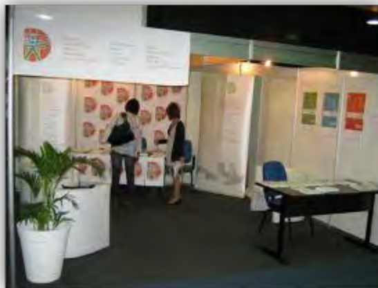
El stand del CIPC durante el Congreso fue de un considerable interés para los delegados

inmigrantes, las poblaciones minoritarias y la juventud, en las tardes, con un panel final acerca de los avances de las herramientas y la formación en prevención de la criminalidad. Los delegados contaron con cuatro periodos de discusión. Las presentaciones y las conclusiones del taller serán lanzamientos a la Comisión de Prevención del Delito y Justicia Penal en Viena en Abril de 2011. El artículo introductorio al taller fue redactado inicialmente por el CIPC.