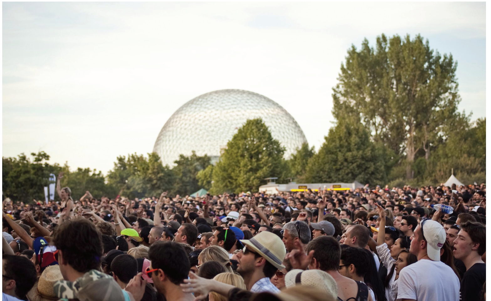
Festival Osheaga

Pour les plus cassés qui restent à Sherbrooke, la 31 e édition de la Fête du Lac des Nations se déroulera du 10 au 15 juillet au parc Jacques-Cartier. La programmation devrait être annoncée sous peu. Je me croise les doigts pour un Jean Leloup en forme.