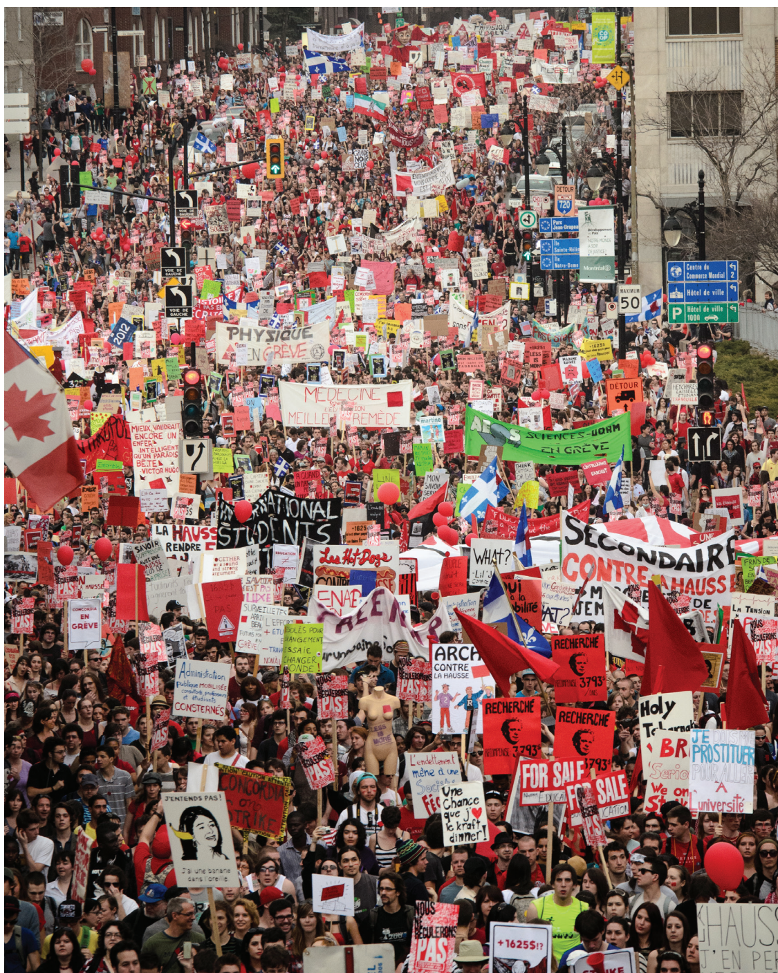
Manifestation nationale contre la hausse des frais de scolarités à Montréal le 22 mars dernier

Plusieurs manifestations pacifiques et d'autres qui l'étaient un peu moins ont eu lieu dans le but de faire reculer le gouvernement face à sa décision d'augmenter les frais de scolarité de 1625 $ par année.