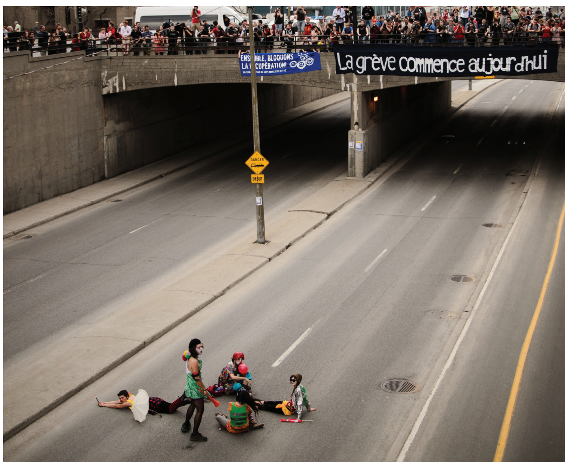
Manifestation nationale contre la hausse des frais de scolarités à Montréal le 22 mars