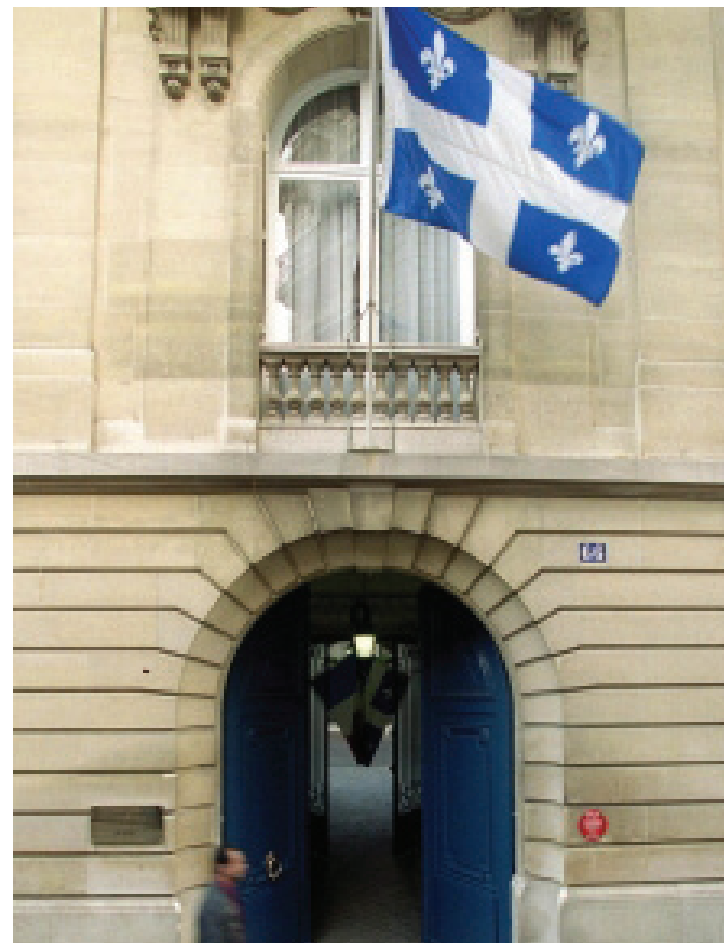
La façade de la délégation du Québec à Paris

Avant de vouer au mépris l'apport économique de la culture, pensons aussi aux nombreux touristes qui dépendent aveuglément dans les rues de Québec ou de Montréal chaque année, charmés par ces caractéristiques qui nous distinguent tant: notre accent, notre cuisine, notre architecture, etc. Si le Québec est une destination vacances plus prisée que le reste du Canada par les friqués d'Américains, ce n'est pas un hasard: c'est parce que les touristes américains ne voient rien d'exotique en l'Ontario ou en l'Alberta, aucun