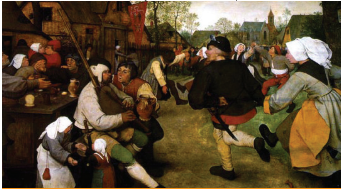
Danse des paysans, Pieter Bregel "l'Ancien", Huile sur bois de chêne, Kunsthistorisches Museum, Vienne.