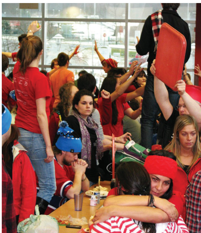
L'événement Freeze en rouge à la cafétéria de l'Université de Sherbrooke