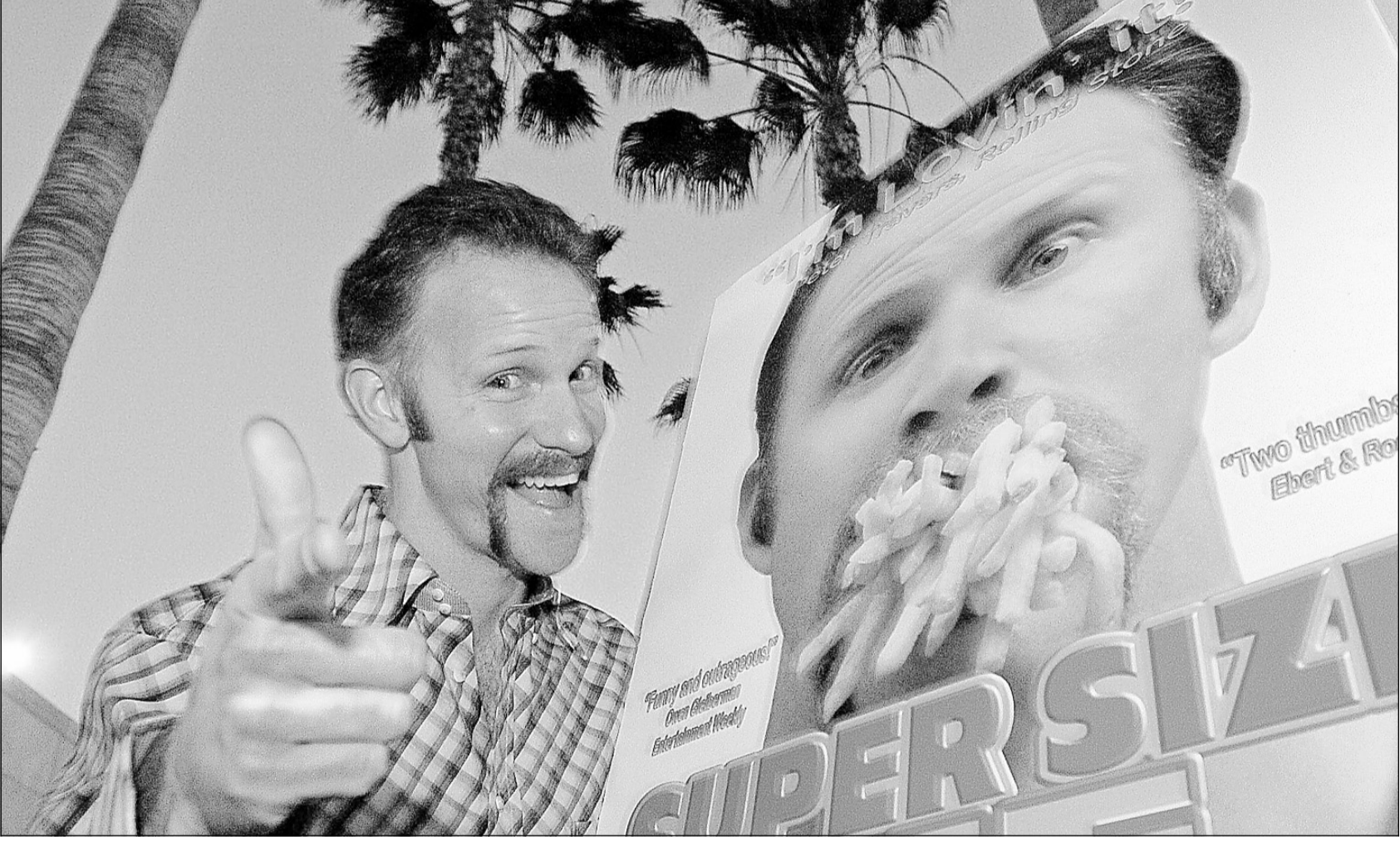
Morgan Spurlock, réalisateur et principal acteur de Super Size Me .

Trop de quelque chose ? On est peut-être sur la bonne voie.