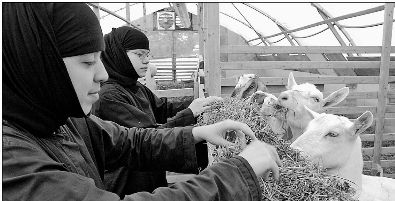
Des religieuses orthodoxes grecques exploitent la fromagerie Le Troupeau bénit, à Brownsburg-Chatham.