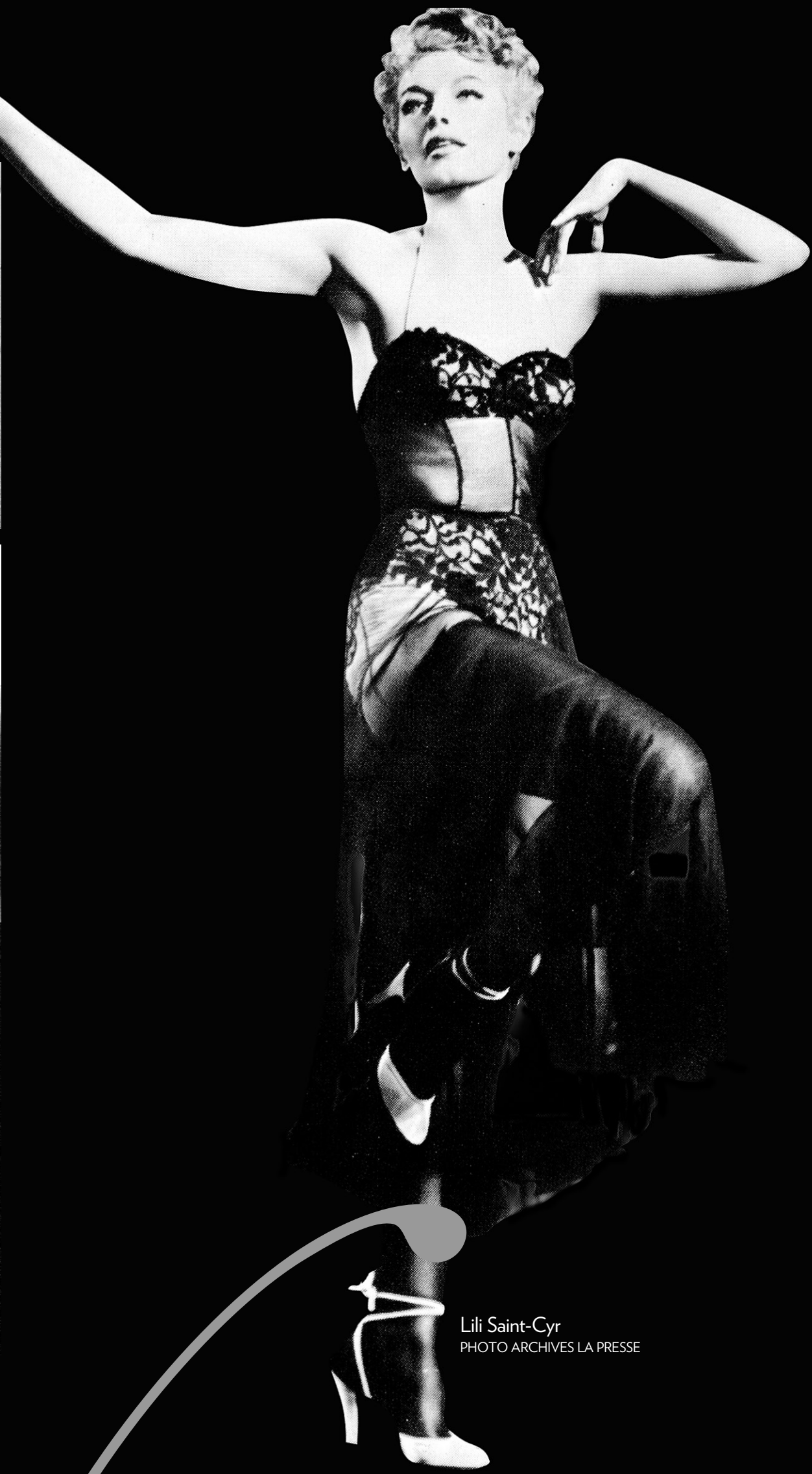
Lili Saint-Cyr