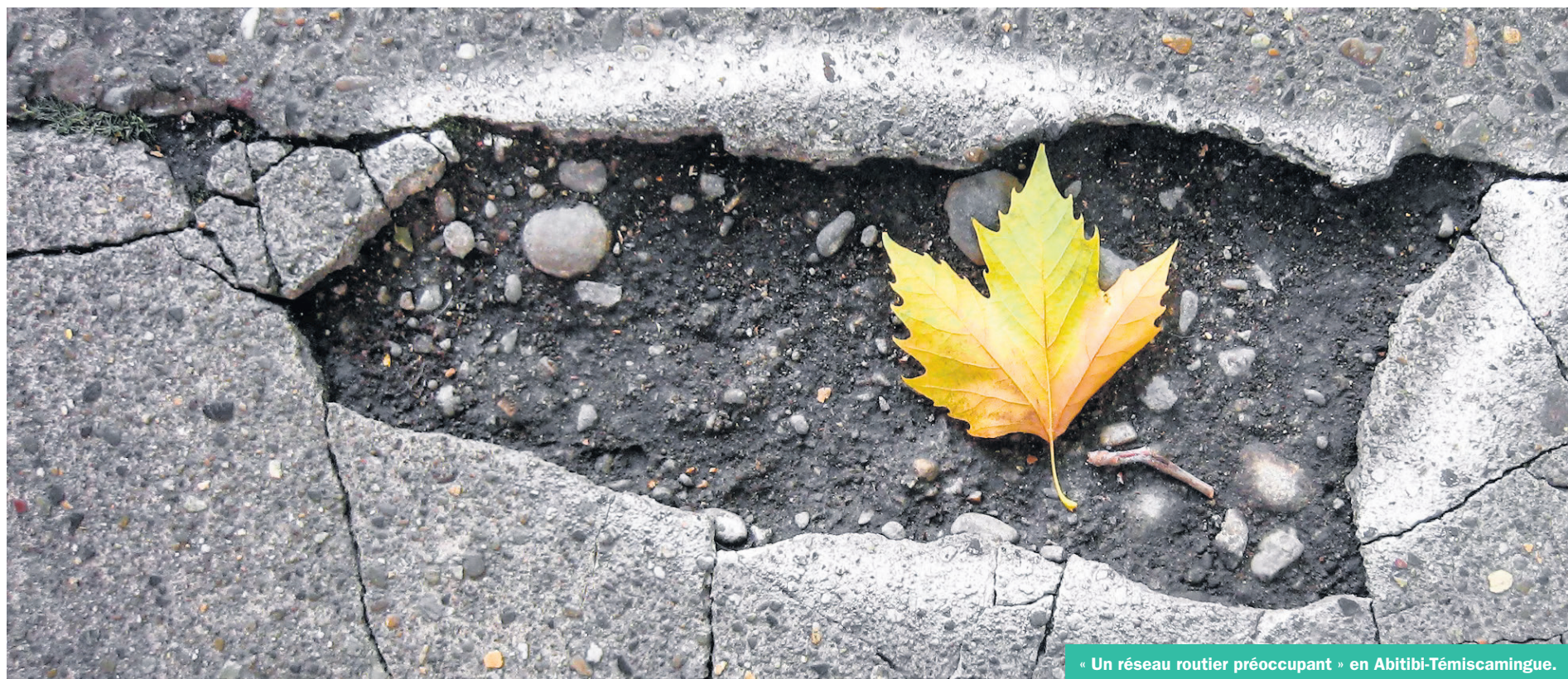
« Un réseau routier préoccupant » en Abitibi-Témiscamingue.