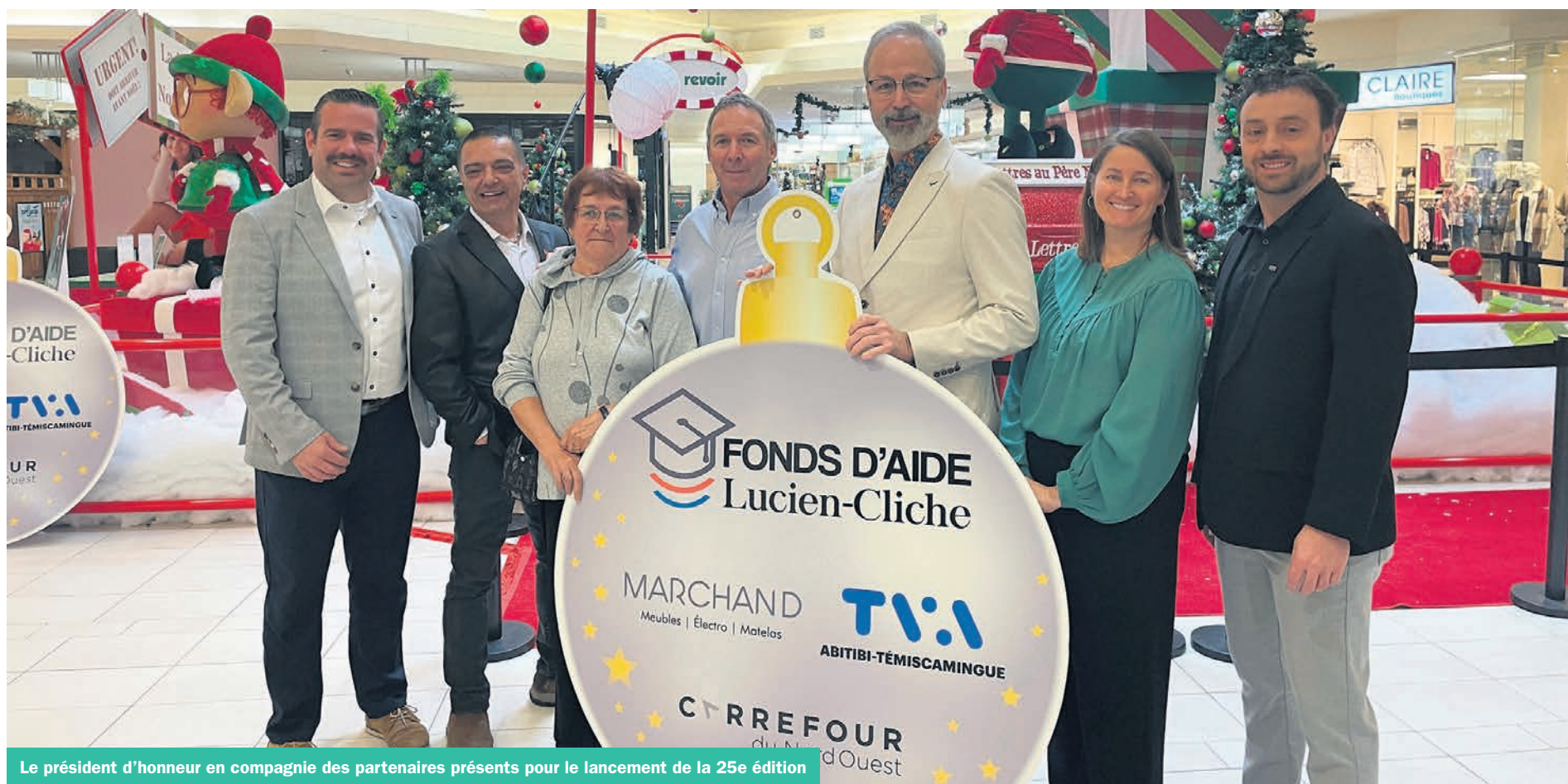
Le président d'honneur en compagnie des partenaires présents pour le lancement de la 25e édition