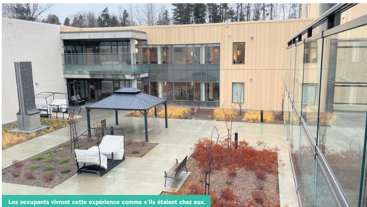
Les occupants vivront cette expérience comme s'ils étaient chez eux.

de Rouyn-Noranda a eu lieu également en ce 22 novembre mais en après-midi.