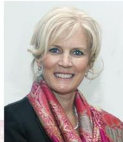
UN MOT de la DIRECTRICE de la FONDATION