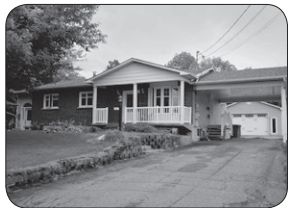
111 RUE MORIN, ST-FRANÇOIS MAISON INTER-GÉNÉRATION CLÉ EN MAIN, 4 CC.