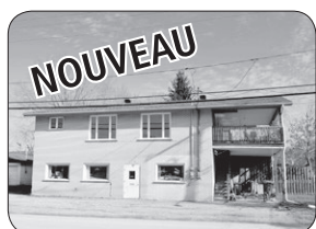
10 GREENLAY S, WINDSOR TOUT BRIQUE, ATELIER AU RDC ET UN 5 ½ AU 2E.