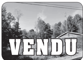
330 DES HIRONDELLES, ST-FRANÇOIS TERRAIN À CONSTRUIRE AVEC ÉGOÛTS