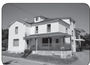
176-176D DE L'ÉGLISE, ST-FRANÇOIS QUINTUPLEX 3 X 5 ½ ET 2 X 4 ½