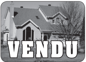
660 RTE 243, VAL JOLI CLÉ EN MAIN, 3 CAC, GRAND TERRAIN.