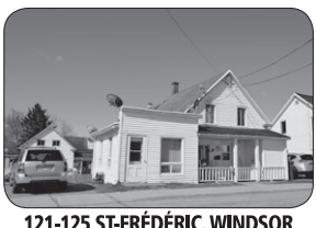
121-125 ST-FRÉDÉRIC, WINDSOR 41, 3E AVENUE, WINDSOR QUADRUPLEX EN 2 BÂTIMENTS, MÊME TERRAIN.