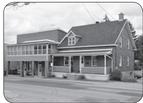
131-139 ST-GEORGES, WINDSOR TRIPLEX - BON INVESTISSEMENT!