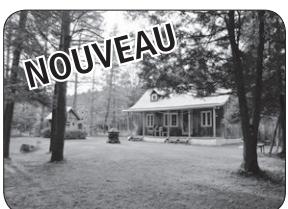
841 RTE 249, ST-CLAUDE CHALET 4 SAISONS, BORD D'UN RUISSEAU