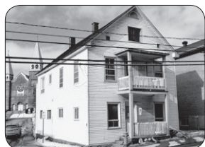
77 LAVAL, SHERBROOKE DUPLEX 1 X 8 ½ ET 1 X 6 ½