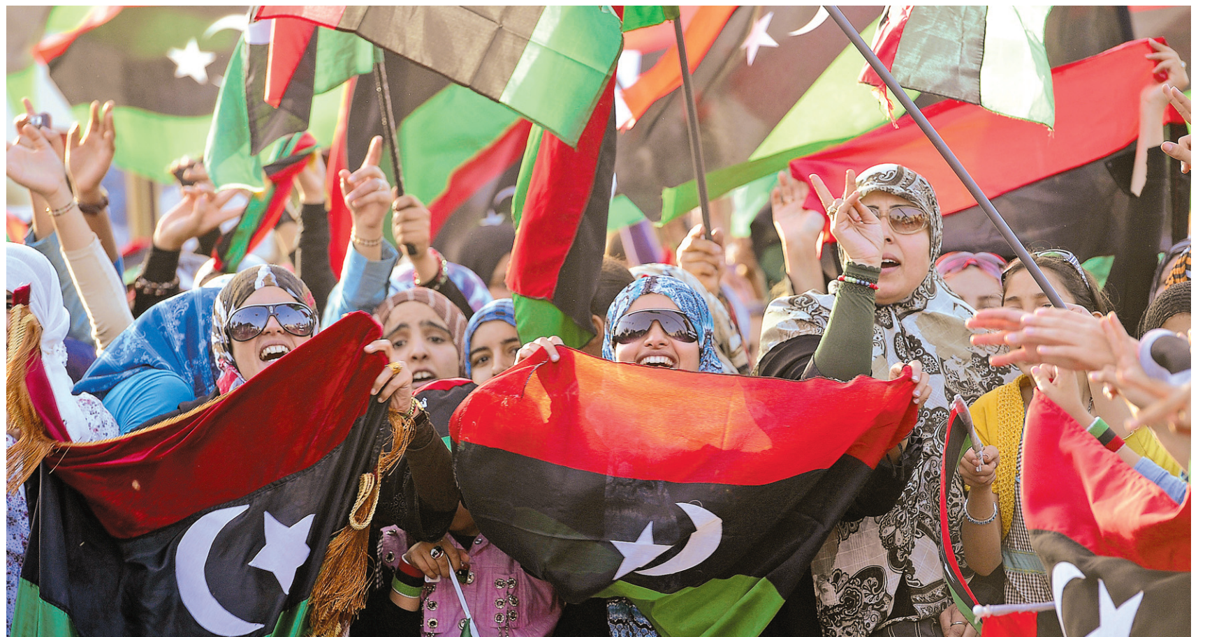
Drapeaux au vent, la proclamation de la «libération» de la Libye après 42 ans d'un régime dictatorial imposé par Mouammar al-Kadhafi, a été accueillie hier dans une ambiance euphorique à Misrata (photo) et un peu partout dans le pays.