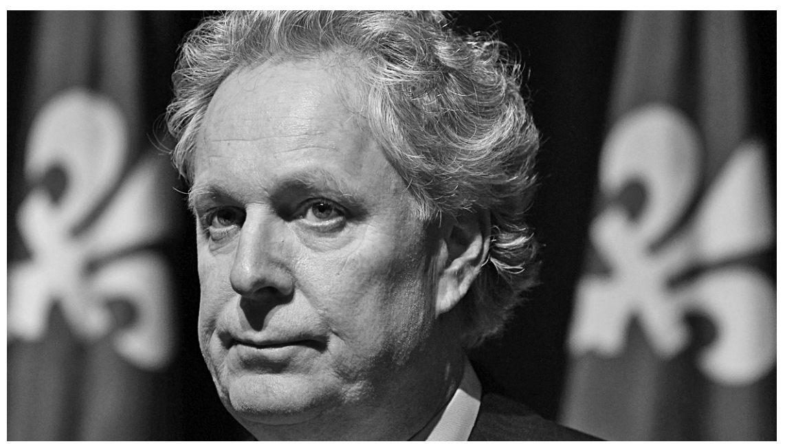
MATHIEU BÉLANGER REUTERS

Après avoir été contredit par la communauté juridique, puis par des organismes policiers, et avoir vu sa commission «sur mesure» rejetée par l'opinion publique, le chef libéral aura trouvé un ultime expédient. Devant 2000 congressistes libéraux auxquels lui-même et tout l'appareil du parti avaient invoqué l'empêchement juridique,