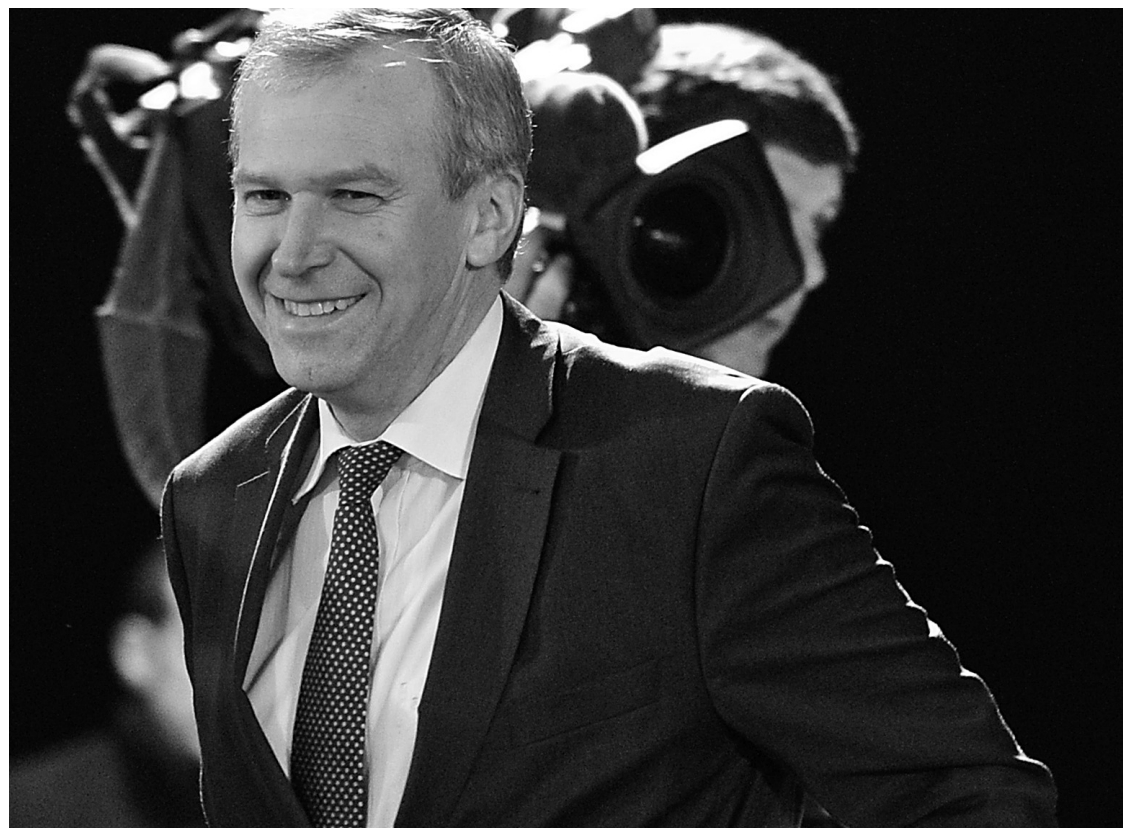
Le premier ministre belge, Yves Leterme, hier, à Bruxelles.