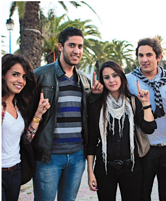
Jeunes Tunisiens hier après avoir voté