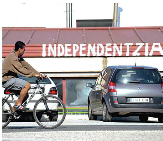
«Indépendance»: dans une rue d'Arbizu, hier, au Pays basque espagnol.