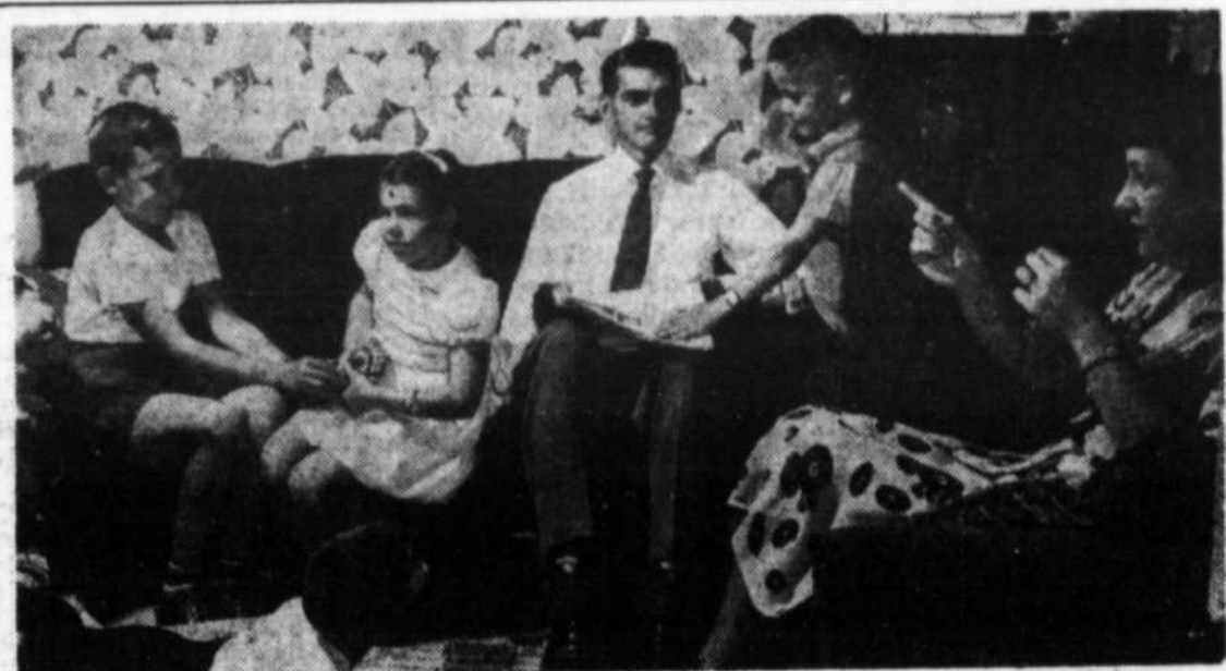
Les parents, premiers éducateurs: tel sera l'un des principaux problèmes étudiés et développés durant la Semaine nationale de la Famille ouvrière, du 14 au 21 octobre prochain.

En un mot, toutes les familles ouvrières de la province sont entraînées par le courant et veulent prendre part à la semaine de la Famille ouvrière du 14 au 21 octobre.