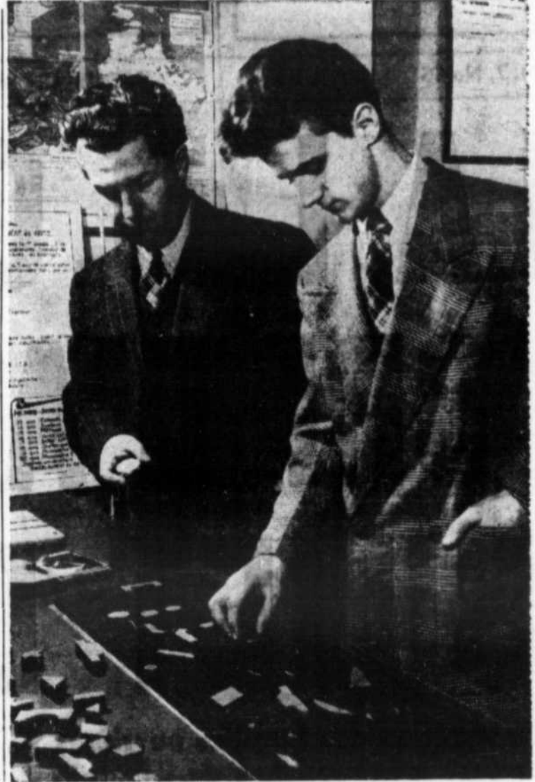
Un service d'Orientation met en valeur les aptitudes de l'élève en ce qui a trait à son avenir. Ci-dessus un élève de l'Ecole des Arts Graphiques de Montréal subissant un test d'intelligence.

Les enfants sont-ils à blâmer? Dans bien peu de cas. La plupart du temps, à l'âge de 14 ou 15 ans, quand la majorité abandonne