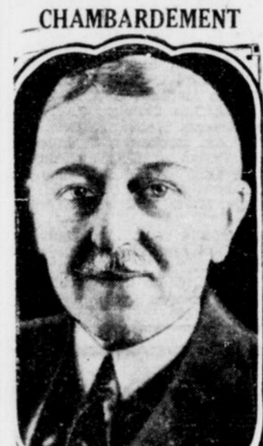
William WOODIN, secrétaire du Trésor aux États-Unis, est relevé de ses fonctions par le président Roosevelt. Il est remplacé pour le moment par Henry Morgenthau.