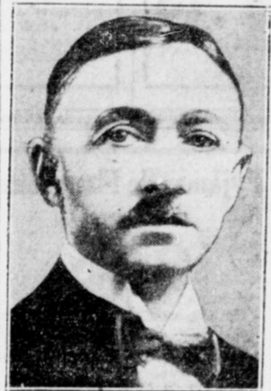
Ivan BUNIN, écrivain russe a gagné le prix Nobel de littérature pour 1933.