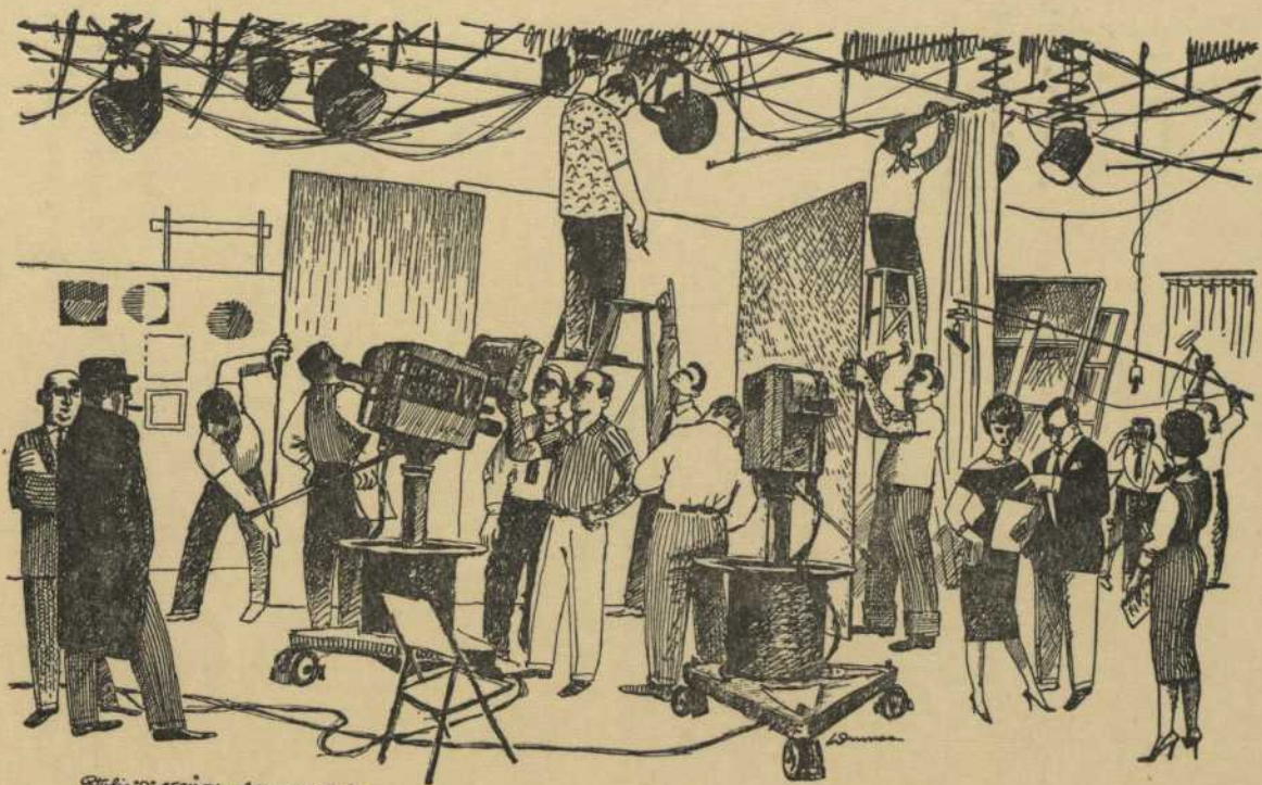
Studio "D", CFCM-TV and CKMI-TV, Québec