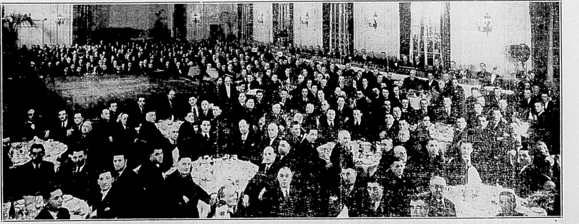
BANQUET ANNUEL DE L'ASSOCIATION DES EMPLOYES DE LA NATIONAL BREWERIES LIMITED.

Les propriétaires de ces nouvelles basses-cours doivent tout d'abord s'engager à exécuter un programme de trois ans. Ils doivent tenir une comptabilité et soumettre tous les mois un rapport au ministère. Ils s'engagent à construire une éleveuse pouvant loger 400 poussins, ainsi qu'un poulailler moderne qui devra abriter 100 poules.