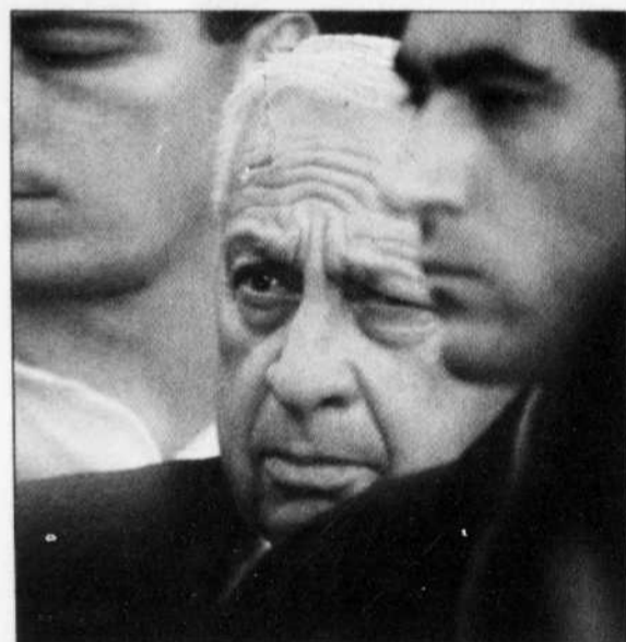
Le premier ministre Ariel Sharon entouré de ses gardes du corps. Le sondage du journal Maariv traduit le profond désarroi des Israéliens.