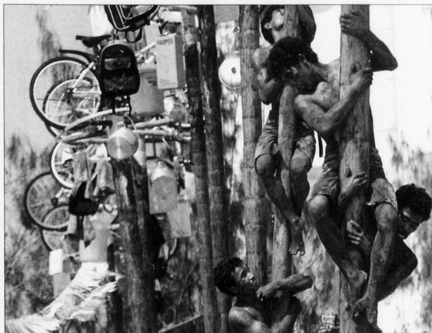
FESTIVITÉS EN INDONÉSIE à l'occasion du 56 e anniversaire de son indépendance. Des hommes enduits d'huile tentent de grimper à des troncs d'arbre au bout desquels se trouvent des cadeaux. L'Indonésie a déclaré son indépendance en 1945 après plus de 350 ans de domination coloniale hollandaise.