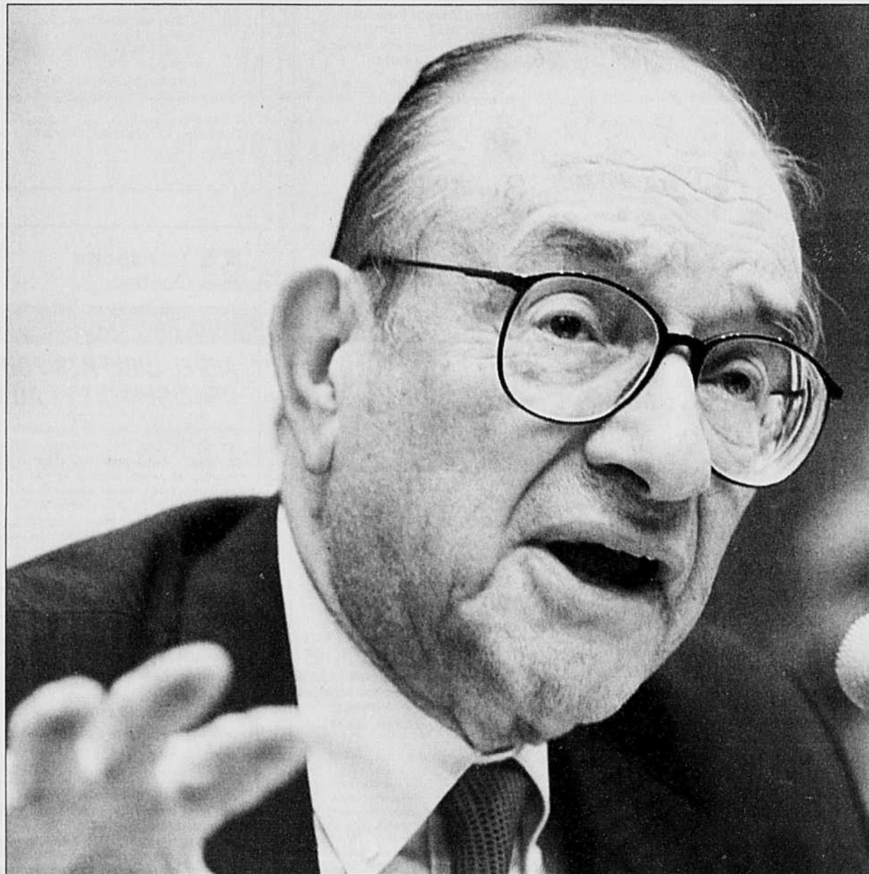
Alan Greenspan: « Agir rapidement et de façon décisive ».

■ juin 1972, Arrow Petroleum, 1 500 $ (Ontario); cette société a tenté d'inciter un détaillant à maintenir le prix de revente de l'essence.