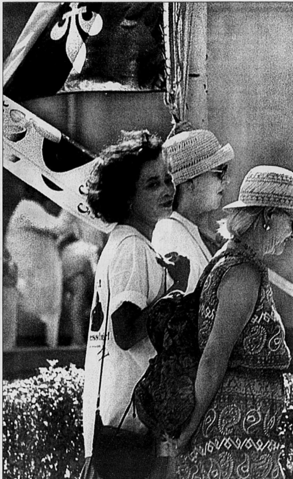
Le fleurdelisé était en berne, hier, au pavillon Notre-Dame du CHUM, où des infirmières manifestaient paisiblement, au lendemain du rejet de l'entente.

À l'Hôtel-Dieu, qui fait partie du Centre hospitalier de l'Université de Montréal (CHUM), les infirmières sont retournées au travail à minuit hier soir, après avoir voté sur