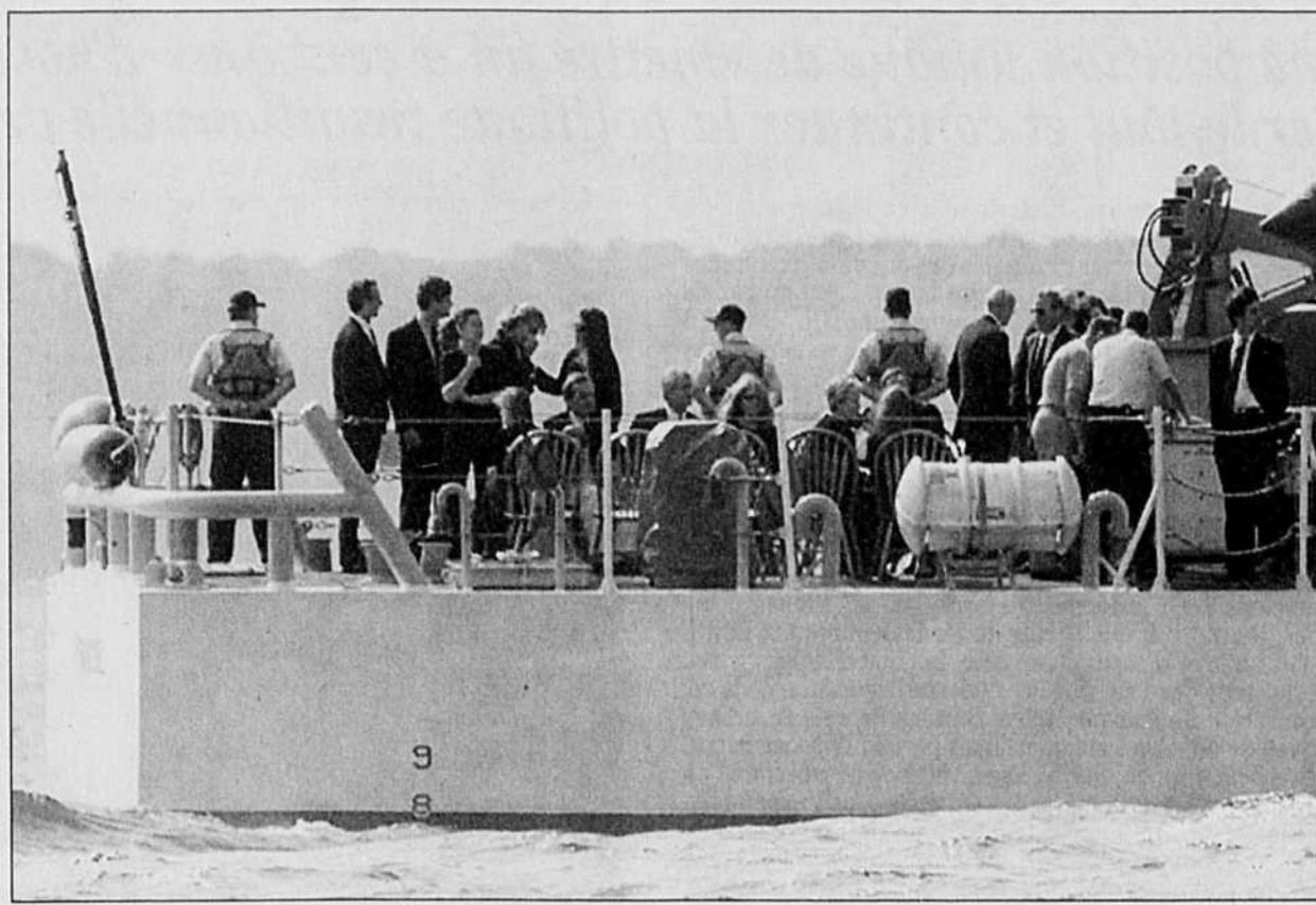
Les familles des trois victimes se sont rendues sur le destroyer USS Briscoe pour la cérémonie.

Le Devoir est publié du lundi au samedi par Le Devoir Inc. dont le siège social est situé au 2050, rue de Bleury, 9 e étage, Montréal, (Québec), H3A 3M9. Il est imprimé par Imprimerie Québec LaSalle, 7743, rue de Bourdeau, division de Imprimeries Québec Inc., 612, rue Saint-Jacques Ouest, Montréal. L'Agence Presse Canadienne est autorisée à employer et à diffuser les informations publiées dans Le Devoir . Le Devoir est distribué par Messageries Dynamiques, division du Groupe Québec Inc., 900, boulevard Saint-Martin Ouest, Laval. Envoi de publication — Enregistrement n° 0858. Dépôt légal: Bibliothèque nationale du Québec.