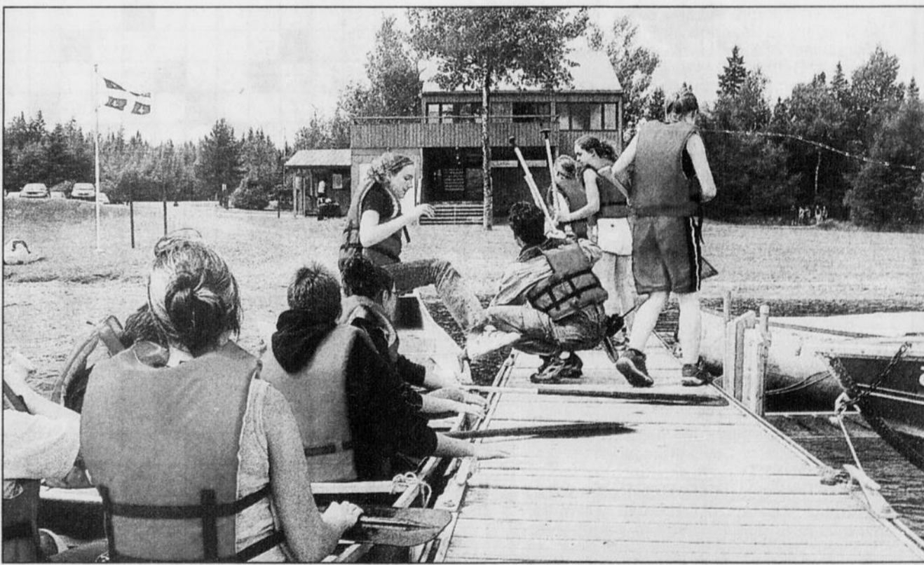
Parc national de Frontenac Le Parc national de Frontenac, situé sur les rives du lac Saint-François, offre des activités en canot rabaska que les amateurs de plein air ne voudront pas manquer. Entre autres, l'Expédition Felton combine randonnée en canot rabaska, la découverte de l'histoire de la région et une dégustation des produits régionaux, dans un cadre enchanteur.

Cinq fournisseurs-partenaires y contribuent: les Bisons du Chef, de Lambton, l'Auberge d'Andromède, de Courcelles, la Ferme du Pêché Mignon, de Saint-Romain, la Fromagerie La Moutonnière et les Produits de l'Érable Saint-Ferdinand B.