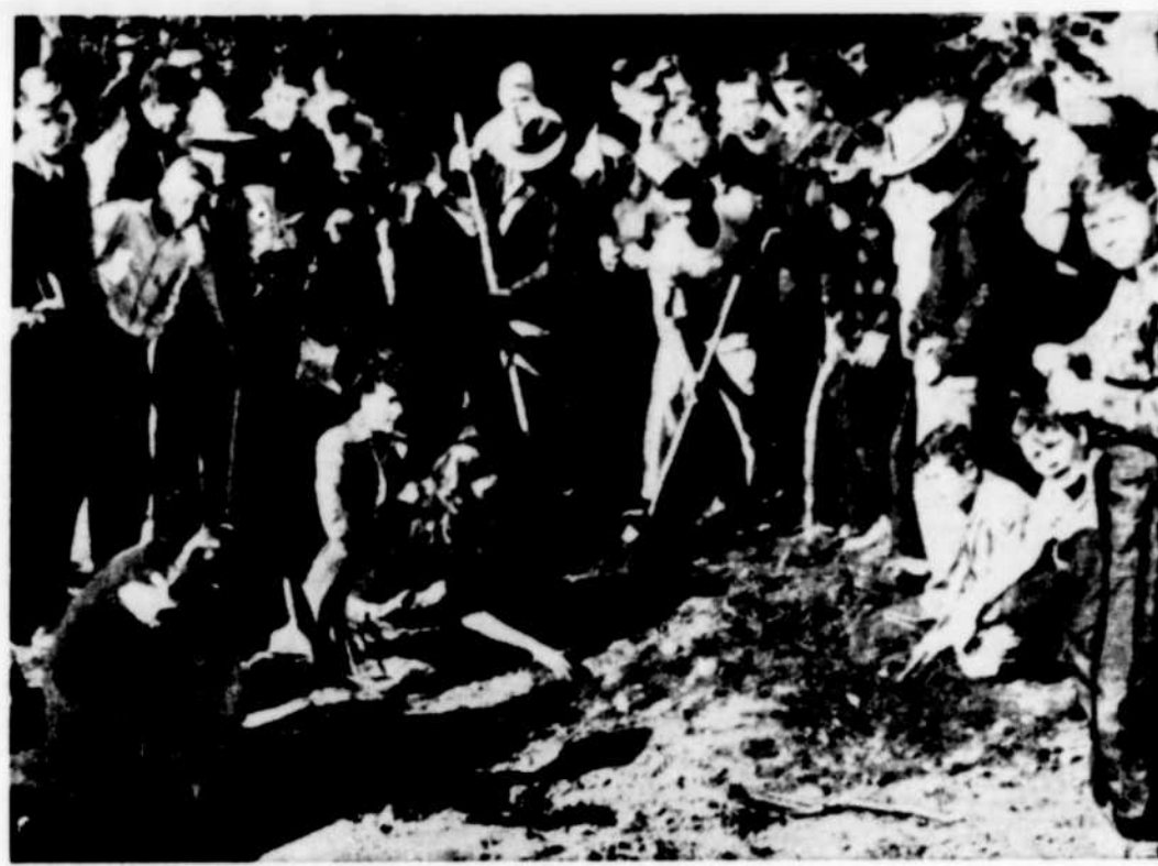
Une centaine d'hommes, de femmes et d'enfants fouillent la nouvelle mine d'or de Monterey, Californie, à l'aide de pelles et autres instruments. A date on a retrouvé plus de 125 pièces d'or.

Le principal objectif du programme de construction pour l'année prochaine est de terminer le plus grand nombre possible des 350.000 maisons présentement sous contrat et d'ajuster le nombre de ces maisons à un niveau proportionnel aux approvisionnements de matériaux en perspectives. On prévoit que les importations de bois de construction l'année prochaine suffiront à la construction complète de 150.000 maisons. Cependant, vu que plusieurs maisons présentement en voie de construction renferment déjà des quantités spécifiques de bois de construction, le nombre qui sera réellement complété en 1948, devrait dépasser de beaucoup 140.000. Les stocks d'acier disponibles pour la construction industrielle seront concentrés sur l'achèvement des projets déjà en voie d'exécution, qui