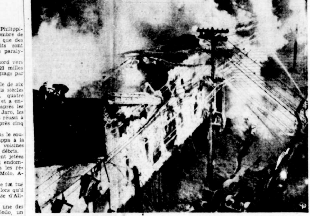
Cet immeuble à trois étages de Hull a été ravagé par un incendie qui a causé des dommages de $200,000. Dix personnes ont été laissées sans foyer, l'une d'elles étant chassée par la fumée de sa demeure pour la deuxième fois ce mois-ci. Six établissements commerciaux ont été détruits. Les pompiers d'Ottawa ont été appelés à la rescousse.