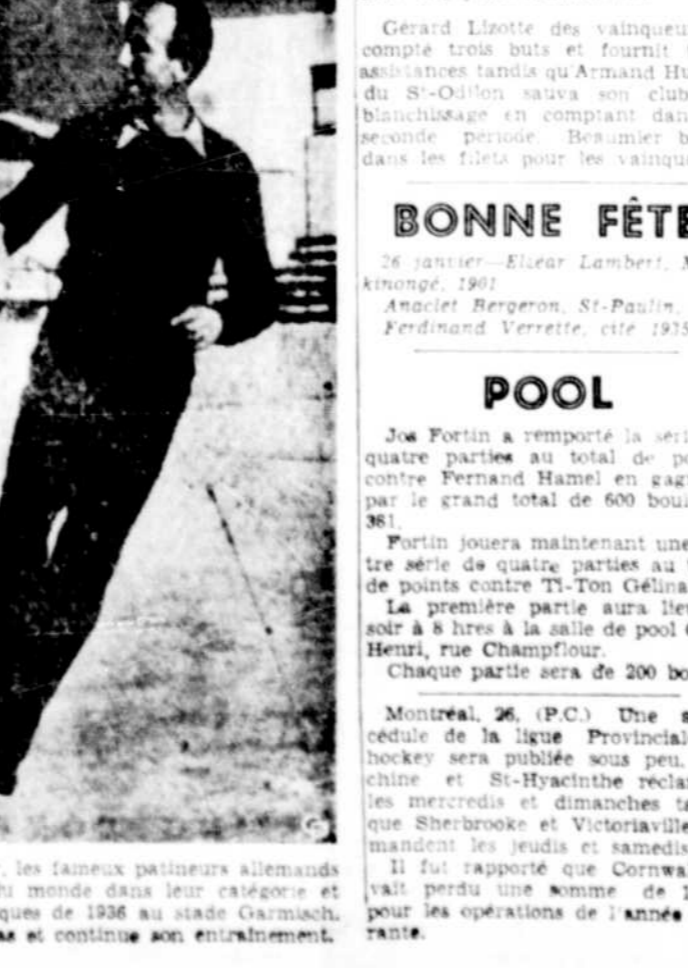
Maxi Herber Bayer et Ernst Bayer, les fameux patineurs allemands reconnus comme les champions du monde dans leur catégorie et qui remporteront les Jeux Olympiques de 1936 au stade Garmisch. La mère tient sa fille dans ses bras et continue son entraînement.