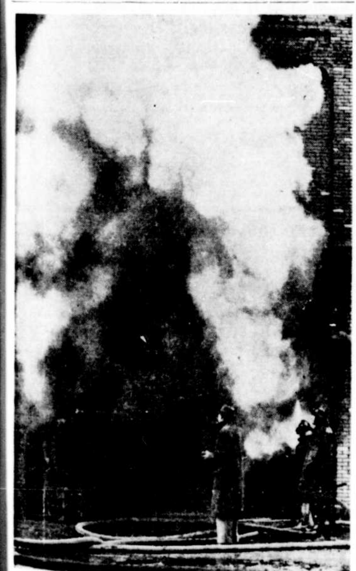
Un gros incendie à Windsor, dans une bijouterie et trois magasins, a causé des dommages évalués à $100.000.