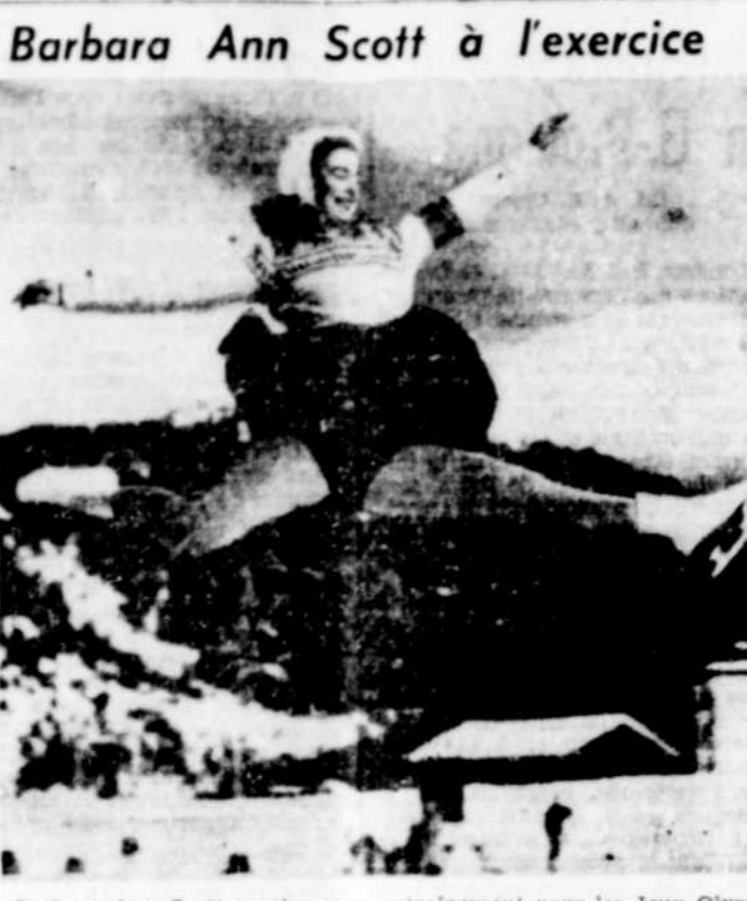
Barbara Ann Scott continue son entraînement pour les Jeux Olympiques du mois de février. Cette photo a été prise en Suisse au moment où la fameuse patineuse canadienne se livrait à un de ses exercices favoris.