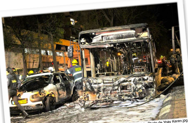
Véhicules calcinés par une roquette à Holon. Wikipedia: 2021 Israeli-Palestine crisis. Photo de Yoav Keren.jpg

Suite à la conflagration déclenchée par les attaques du Hamas sur la capitale hébraïque le printemps dernier, la réponse cinglante d'Israël pour discipliner cette entité malveillante ne se fit pas attendre 1 ... ni les condamnations à l'encontre des Israéliens pour avoir eu le 'culot' de se défendre.