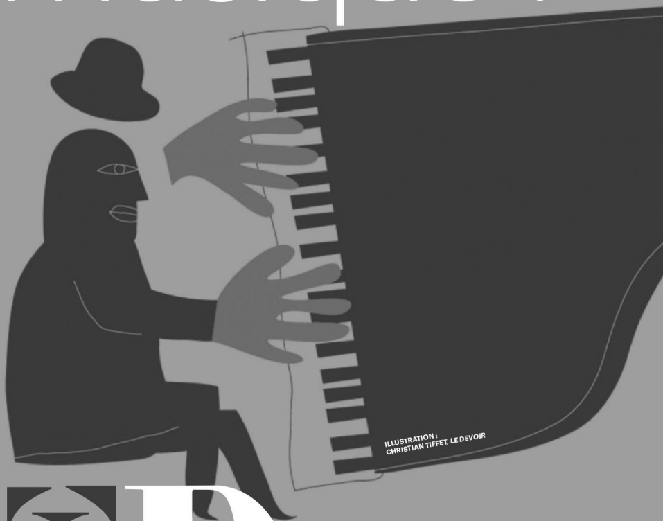
ILLUSTRATION : CHRISTIAN TIFFET, LE DEVOIR