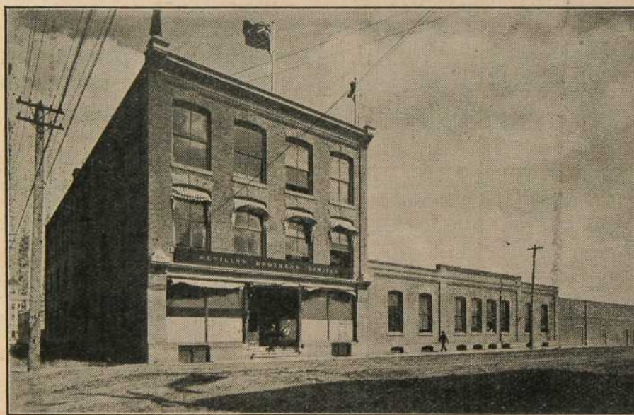
Etablissement Revillon Frères Ltée à Edmonton.