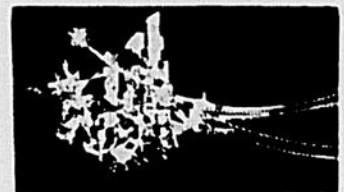
Détail de la fresque de Frédéric Back, au cinéma Vendôme.