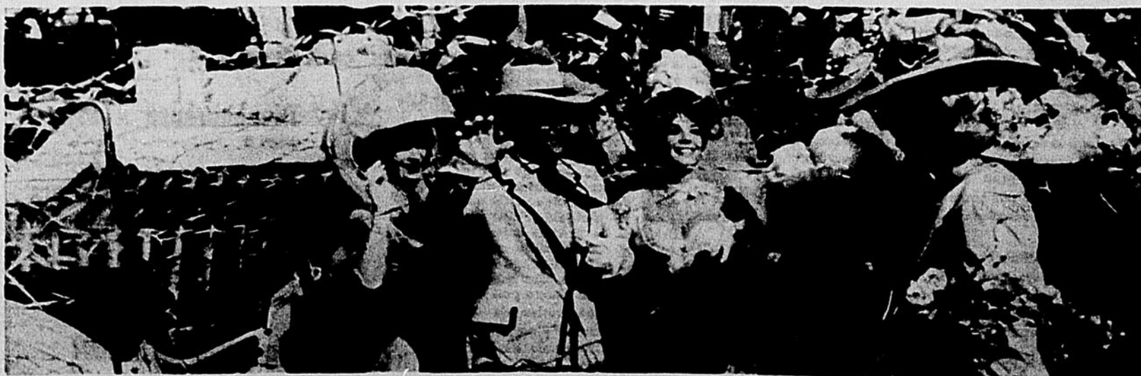
On aperçoit ci-haut, portant fièrement chapeau et gants blancs, le maire Jean Drapeau à l'ouverture de l'Expo '67. Ne voit-on pas, à l'extrême droite, la gracieuse silhouette de Grace Kelly ? Cette photo fut prise la semaine dernière par un véhicule spatial américain. Très avant-gardiste, ce document fera les délices de tous les prophètes.

C'est lundi, le 25 octobre, que fut lancé la troisième édition de "Menu Magazine". Pour faire honneur à son nom, le magazine a offert une dégustation préparée, supposément, par des cuistots de grande classe. Le Ramada Inn a eu l'honneur d'accueillir les invités.