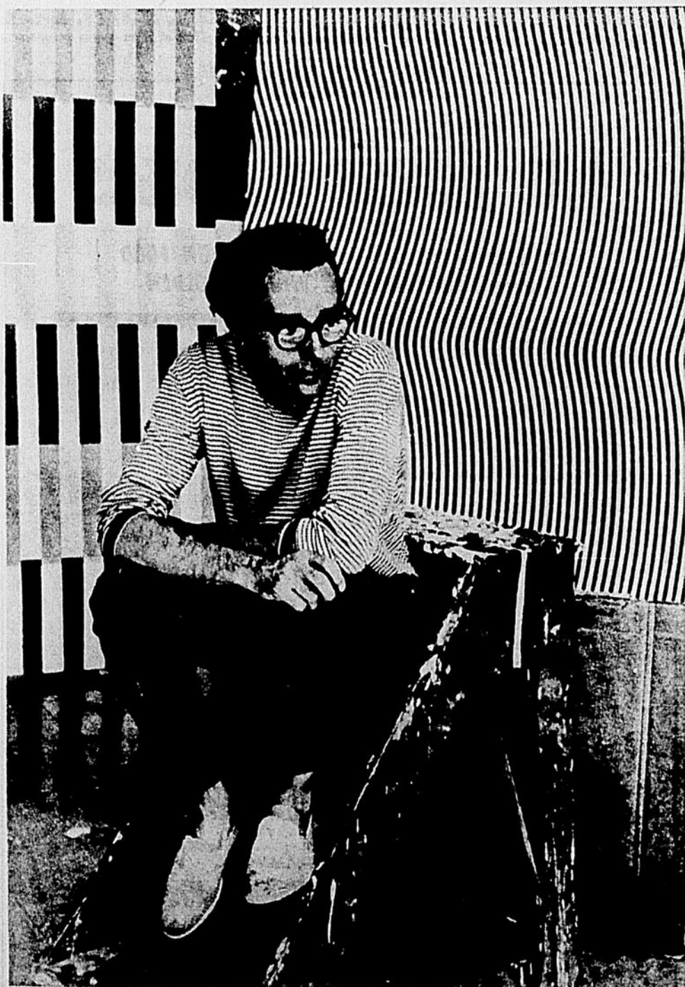
Les Barbeau du Siècle : un art opt... imiste et enti... septique, cu la pureté des effets rétinien.