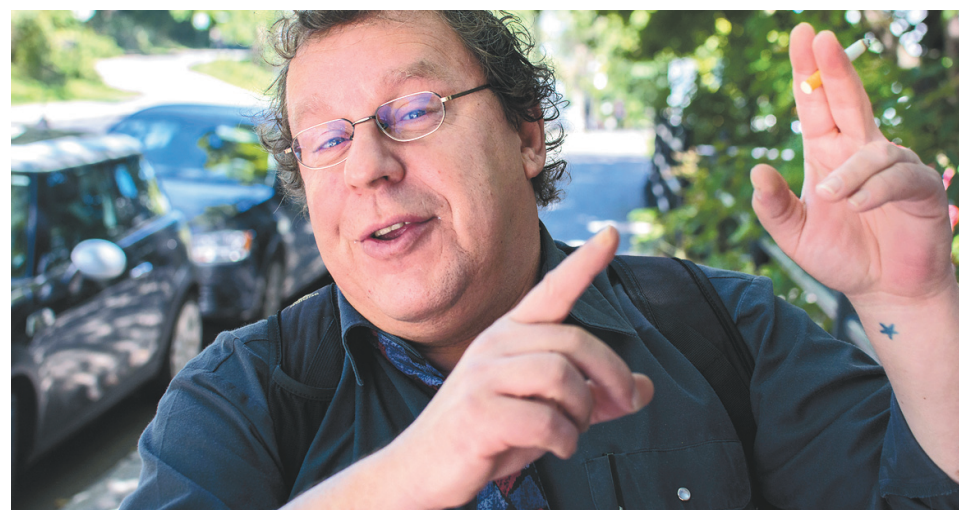
L'homme de théâtre René-Daniel Dubois