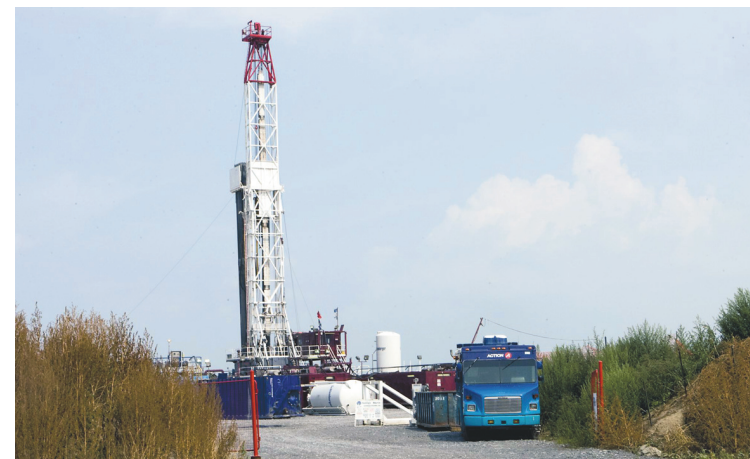
ANNIK MH DE CARUFEL LE DEVOIR

Le regroupement souhaite donc que Québec procède à un inventaire des quelque 600 à 900 puits abandonnés et colmate les fuites s'il y a lieu. « Le ministre du Développement durable, de