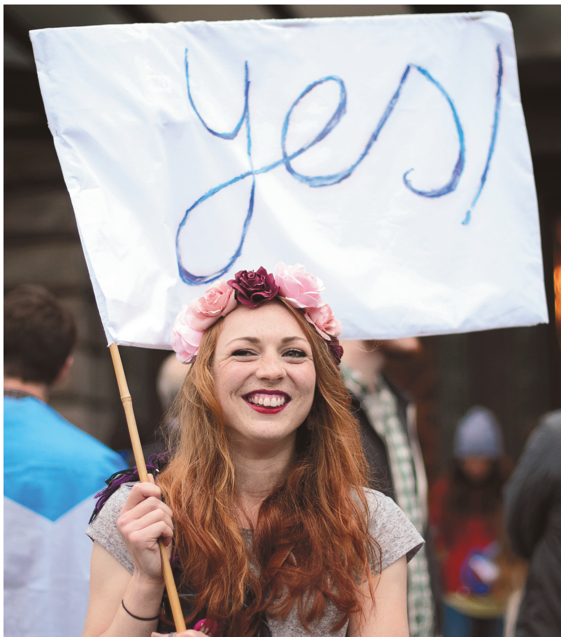
Les deux camps entrent dans un blitz de mobilisation en vue du référendum qui aura lieu jeudi.