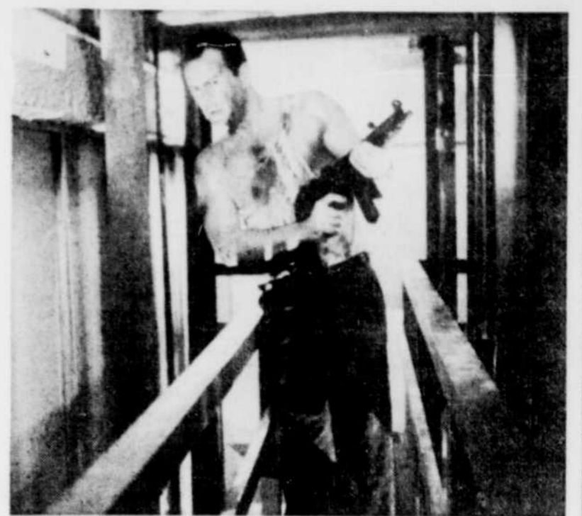
Dans « Die Hard », Bruce Willis se donne des allures de Rambo.

Il ne faudrait évidemment pas oublier le jeu de Bruce Willis qui nous fait oublier ses premières présences au grand écran dans Blind Date et Sunset . Deux films qui confirmaient le déclin inéluctable