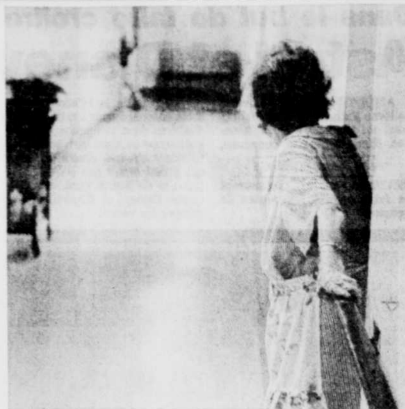
L'Alzheimer: la terrible maladie n'épargne aucune couche de la société