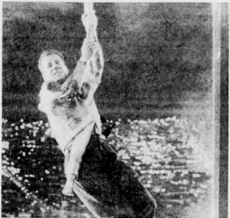
Le policier John McClane (Bruce Willis) doit déployer toutes ses ruses afin de sauver un groupe d'otages détenu dans un gratte-ciel de Los Angeles par des terroristes. Un film à ne pas recommander aux personnes souffrant de vertiges!