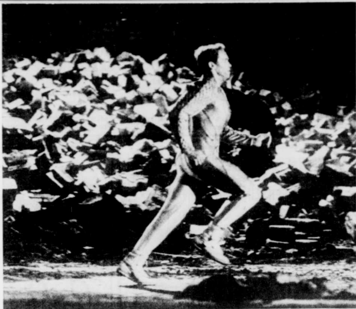
Arnold Schwarzenegger dans le film « Running man », beaucoup moins intéressant que le roman qui l'a inspiré.

Il y a quelque chose qui tient de la mythologie grecque dans le roman de King. Il suffisait d'ajouter