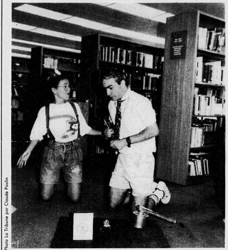
Dans le cadre d'une campagne d'information sur les dangers reliés à l'usage des pesticides, une pièce de théâtre sera offerte tout l'été dans les parcs, mettant en vedette un utilisateur de pesticides qui a la phobie des bestioles et sa voisine qui défend l'environnement.

De la bière dans un récipient à la hauteur du sol dans votre jardin attirera les limaces, qui ne demandent pas mieux que de s'y noyer!