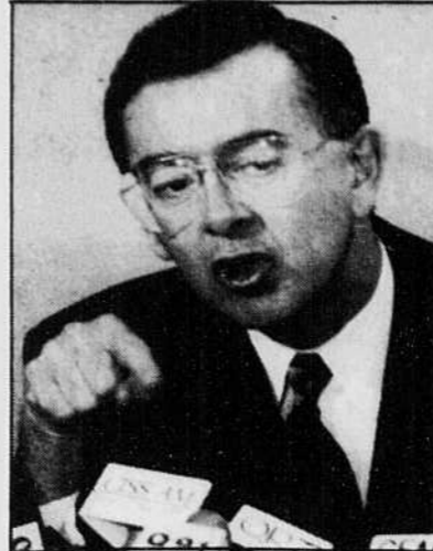
Les contributions personnelles au Reform Party de Preston Manning ont triplé de 1989 à 90.

Et, pendant que le nombre de contributions personnelles versées au Reform Party triplait de 1989 à 1990, le