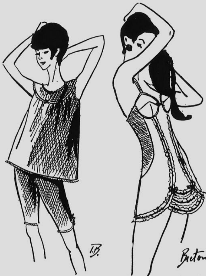
Nuisette de Rosy de Paris avec empiècement rond et bermuda assorti en voile de coton arlequin.