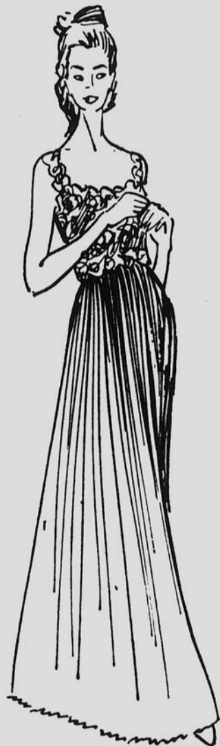
Chemise de nuit en nylon et dentelle de "Triumph international"

combinés moulants comme une seconde peau, presque invisibles tout en conservant cette vertu essentielle pour laquelle ils sont conçus et portés: amincir et maintenir les formes du corps féminin. Libérée des exigences de la mode, la lingerie de nuit peut, par contre, s'abandonner aux charmes désuets des traditions. Rien ne s'oppose plus, à l'heure du coucher, à ce que les femmes retrouvent les franfreluches adorables et coquettes pour lesquelles elles ont toujours eu beaucoup de tendresse. Seuls les tissus changent, et ici encore, la fibre