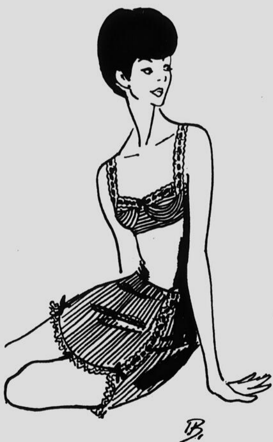
De Pierre Cardin, parure "pékin" 4 pièces en pékin blanc et noir, orné de dentelle à trous de satin noir garnissant toute la parure sauf le slip.

synthétique séduit par les facilités d'entretien qu'elle apporte. Le nylon est roi; heureusement, de nos jours, il sait prendre l'apparence de la dentelle, du voile, de la batiste, bref de tous ces tissus qui nous étaient chers.