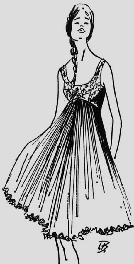
De Christian Dior Boutique, chemise de nuit courte en voile et dentelle de nylon blanc.