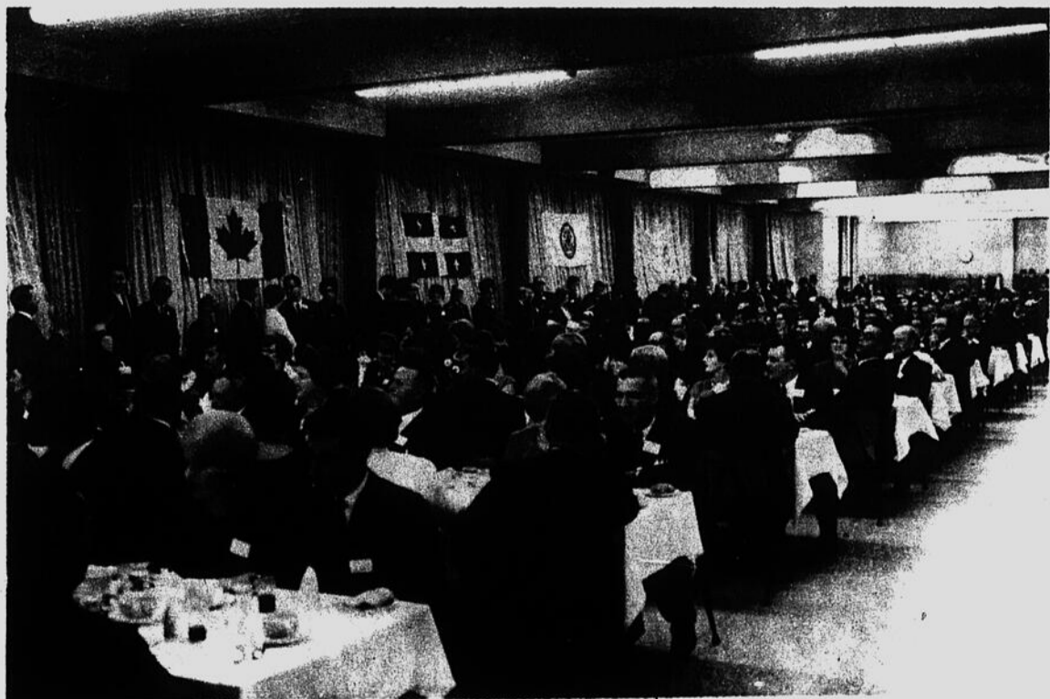
● Vue d'une partie des congressistes qui ont participé au premier congrès des Caisses populaires du diocèse de Sherbrooke, qui s'est tenu dimanche dernier à l'Université de Sherbrooke. 650 personnes ont assisté à ce congrès.

On souhaite également que ces taux soient uniformes à travers toutes les Caisses Populaires du diocèse.