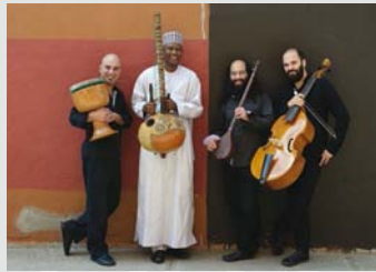
CONSTANTINOPE Jardins migrants Vendredi 20 janvier à 20 h Coût : 33 $ (étudiant : 15 $)