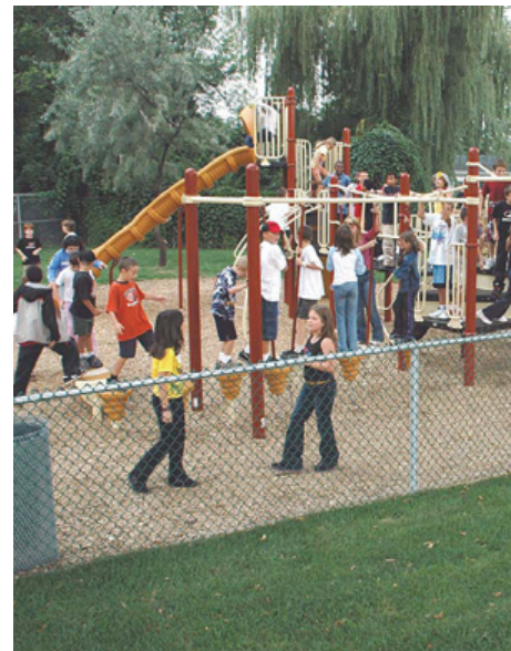
Youngsters having fun in the newly built playground at school-park St-Jude.