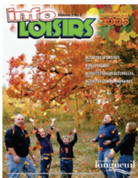
Info Loisirs d'automne distribué le 5 août dernier.

D'ailleurs, si vous souhaitez obtenir une pochette d'information, nous vous invitons à vous présenter à la réception du bureau d'arrondissement, situé au 156, boulevard Churchill. Le personnel du Service à la clientèle peut également répondre à vos questions, il suffit de téléphoner au 463-7041.