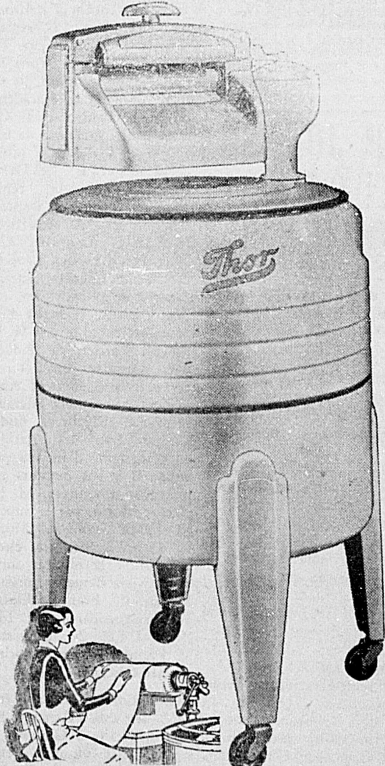
La repasseuse modèle O s'adapte à la colonne du tordeur