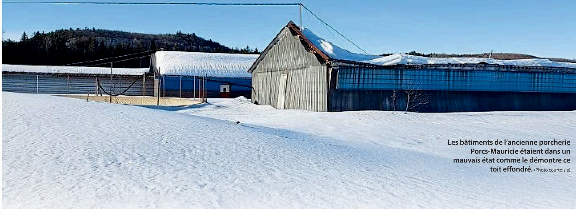
Les bâtiments de l'ancienne porcherie Porcs-Mauricie étaient dans un mauvais état comme le démontre ce toit effondré.