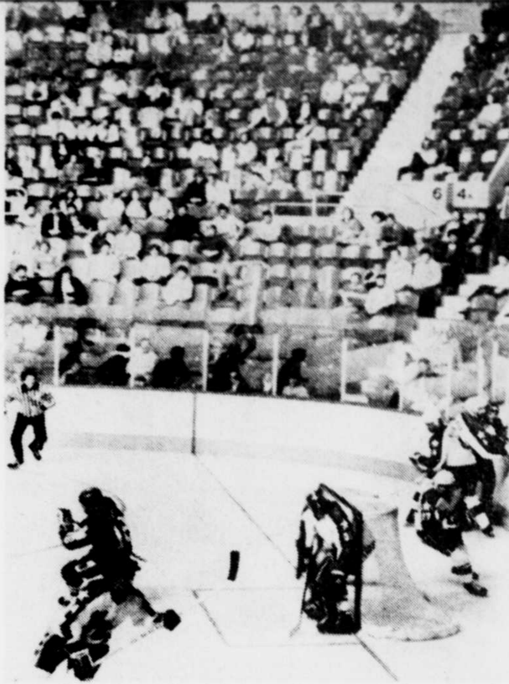
Cette photo parle par elle-même pour expliquer pourquoi Coupe Canada tournera le dos à la ville de Québec. De trop nombreux sièges vacants, lors de la joute de lundi dernier, justifient pleinement la modification de l'horaire en faveur d'Ottawa.

"Les succès anticipés d'une telle équipe, aussi bien aux guichets qu'au niveau des droits de télévision, seraient tels qu'on ne pourrait plus ignorer le Québec dans les tournois internationaux de hockey," a-t-il dit.