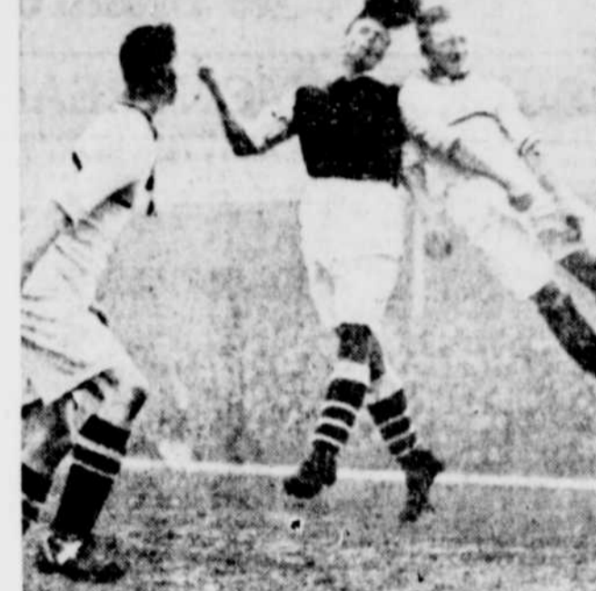
Voici une pose typique prise au cours d'une récente soirée de football en Angleterre lorsque le Arsenal un des meilleurs clubs de la ligue d'Angleterre fut vaincu par le Aston Villa. Les deux joueurs qui frappent le ballon de leur tête sont David Jack à gauche et Blair à droite. Ce dernier est le capitaine du Aston Villa.