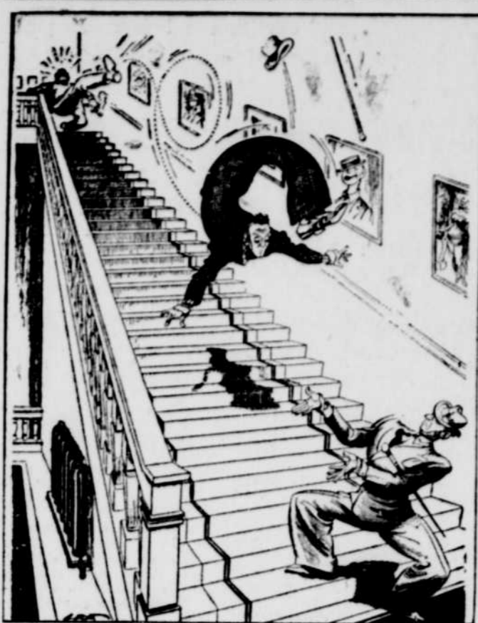
'Boutille d'inspiration, Félix. Ce type n'a pas de place pour notre acte.

Les chargements ferroviaires sur les chemins de fer américains ont diminué de 19 wagons durant la semaine du 31 mars 1954 par rapport à la semaine précédente.