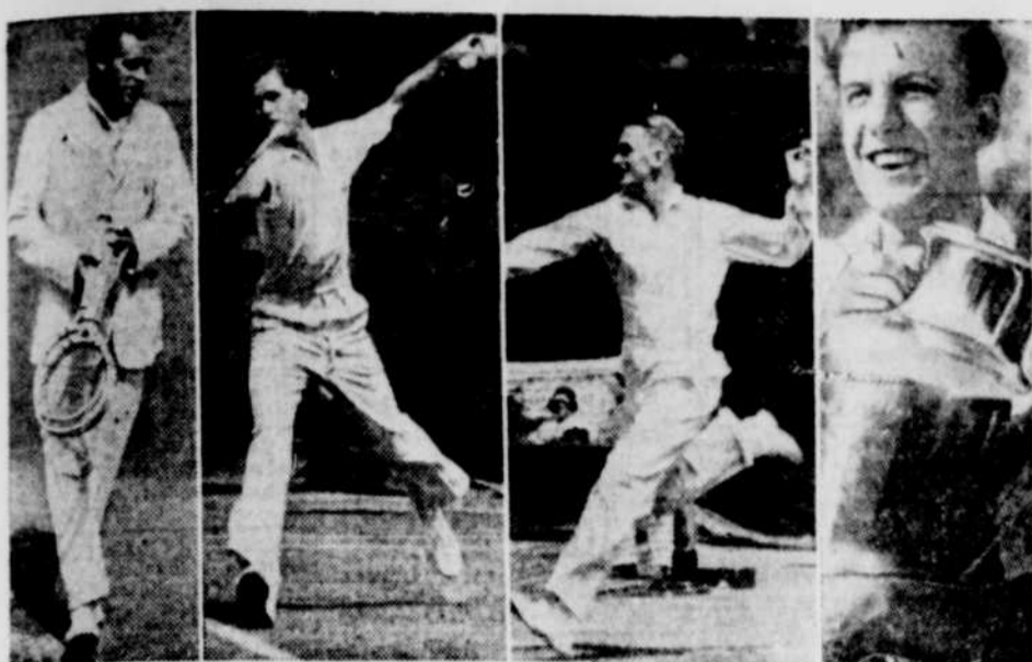
Une question plus que jamais aux Etats-Unis d'organiser des rencontres entre les meilleurs joueurs de tennis du monde professionnels et à mettre en dépit du refus de l'association du tennis des Etats-Unis. A la suite de ce refus Tilden et Vines anxieux de prouver la supériorité des professionnels sur les amateurs ont lancé un défi à Jack Crawford d'Australie et à Fred Perry d'Angleterre. On voit ces quatre joueurs de gauche à droite.